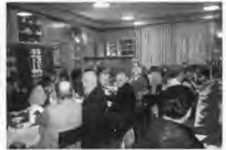
Adventsnachmittag in der Haushaltungsschule.

Anschließend sind wir in einer großen Gruppe zum Theater gefahren, wo wir den Auftritt des Chores der Deutschen Sozial-Kulturellen Gesellschaft bewundert haben. Wie im letzten Jahr, so fand auch dieses Jahr wieder ein Folklore-Festival statt. „Unser Chor“ bildete mit Weihnachtsliedern wieder den Abschluß der Veranstal-