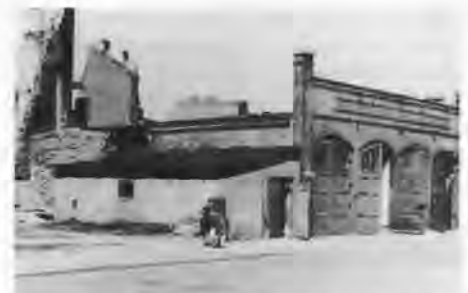
Was vom Feuerwehr-Depot 1945 noch übrig blieb.

und mit beim Transport aus Schneidemühl. Ich hatte von den Russen allerhand Sachen erhalten, auch ein Bett. Wir lagen zehn Tage auf dem Bahnhof, es wurde aufgrund der Transportlisten von Russen und Polen geprüft, ob etwas gegen jemand vorlag. Inzwischen ging mancher Zug mit Zivilgefangenen im Viehwagen, doppelter Etage, ab nach Polen oder sonst wohin. Im Lager waren 6000 Zivilgefangene. Es war schrecklich zu sehen, wie sie zusammengepfercht waren. Luken und Türen zu, so standen sie einen Tag und Nacht auf dem Bahnhof. Der Pole ließ niemand von uns an den Zug. Die Menschen hatten Durst. Nicht einmal die Angehörigen durften an den Zug, um Abschied von ihren Männern zu nehmen. Dann kam der Russe und sah, was hier los war, der schaffte den Zustand so ziemlich ab, wir mußten gestehen, er war immer noch menschlicher als der Pole.