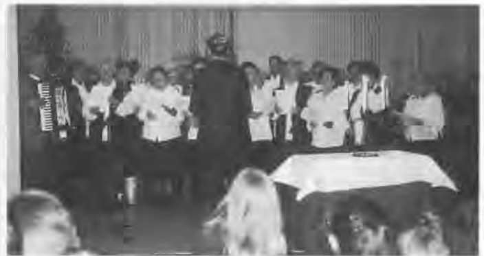
Der Frauenchor sang altvertraute Weisen.