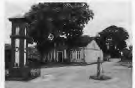
Schulzendorf: Haus Lüdtko am Dorfplatz mit Kreuz und Pumpe.