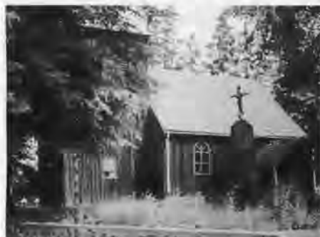
Schulzendorf: Kirche mit Ehrenmal.

50 Jahre sind vergangen, bis ich Rederitz betreten konnte. Eine Sonderfahrt mit ehemaligen Heimatvertriebenen ermöglichte es mir, Rederitz und den Kreis Deutsch Krone wiederzusehen. Ehe ich die Reise angetreten hatte, war mir schon sehr mul-