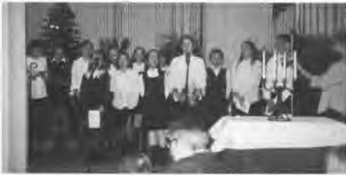
Begeisterte Nachwuchssänger halfen bei der Gestaltung der Feier.