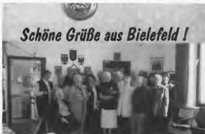
Aus Bielefeld grüßt die dortige Grenzmarkgruppe.