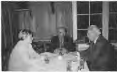
Beim Gespräch mit Bürgermeister Tude- rek und Dolmetscherin.