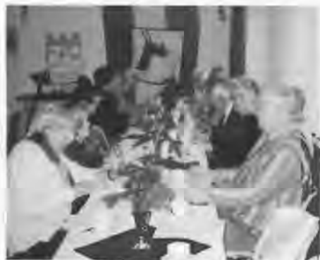
Weihnachtsfeier in Frankfurt/Main am 14. Dezember 2001 (Teilansicht).