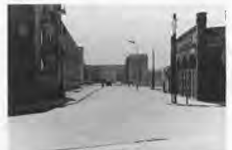
Hasselstraße mit Blick zum Marktplatz; rechts das Depot der Feuerwehr, alle anderen Häuser sind neu.

Wir nahmen Verbindung zu Dr. Buschmann auf. Er lag anfangs mit dem Volkssturm in der Fabrik, später in der Jastrower Allee. Ich teilte nun die Leute ein: ein Teil kam in den Bunker hinter der Fabrik, die anderen nahm ich ins Wohnhaus. Den Bunker hatte Iwanowitsch. Nach fünf Tagen mußte der Bunker geräumt werden, weil ihn unsere Soldaten belegten. Nun nahm ich alle ins Haus in die Keller. Einige Tage später mußten wir vollständig räumen und uns Unterkunft suchen. Wir lagen dann im Haus von Glübe (?) neben der Kaserne Krojanker Straße. Kurz vorher hatte ein Pole, der bei Teske arbeitete, die Baracke gegenüber, den Stall und die Lehrwerkstatt angezündet. Wir löschten so gut es ging mit Schneewasser, denn die Schläuche froren ein. Mit einer Spritze war nichts zu machen. Wir konnten unsere Räume retten, aber die Baracken brannten bis zum Sägewerk nieder. Die Polen hatten tüchtig beim Löschen geholfen und waren über den Brandstifter sehr ärgerlich. Da sie sich gut benahmen, sorgte ich auch für sie. Wir blieben zusammen, bis die Russen kamen. Wir sollten in die Baracken neben dem Friedhof ziehen. Dies setzte ich auch für die Polen durch, denn wir hatten alle Tage Artillerie- und Fliegerbeschuß, und dabei wären sie umgekommen.