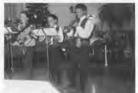
Junge Musikanten erfreuten die Zuhörer mit Weihnachtsliedern.