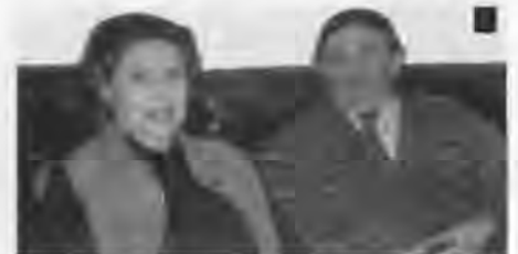
6. Dezember 2001: Der Nikolaus in Jastrow kam aus Lübeck.

Memelstraße 19 23554 Lübeck Telefon (04 51) 40 16 49