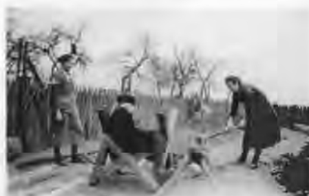
Wer kennt noch einen Sägebock? – Brennholzzubereitung bei „Timmerdöegs“ in Rederitz.