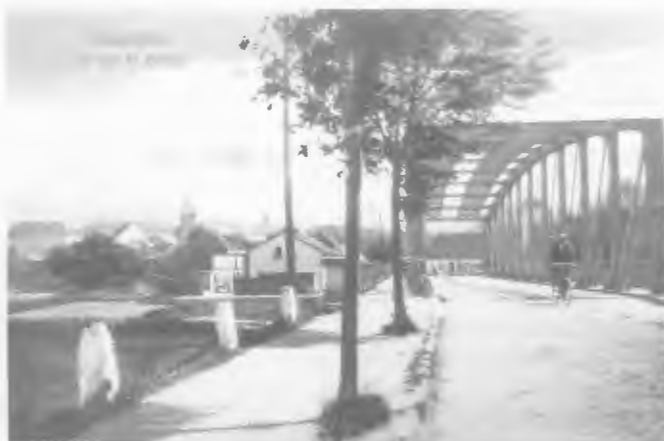
Die damalige kleine Brücke.