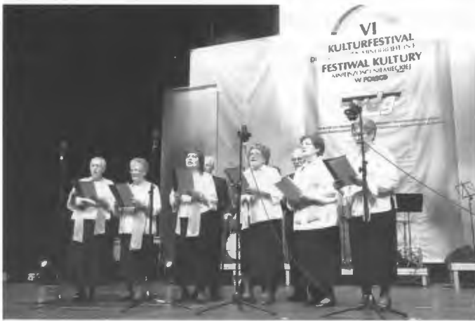
Kulturprogramm auf großer Bühne mit dem Chor der DSKG Schneidemühl

Ab 2003 wird Breslau alle drei Jahre zu einem Ort der Begegnung, der Kultur und der Freude der Angehörigen der deutschen Minderheit in Polen. Am vorletzten Sonnabend im September war es dieses Jahr nicht anders. Zum 6. KMN-Festival kamen hauptsächlich Teilnehmer aus Schlesien, aber auch aus dem Ermland, Masuren und Pommern. In das Festival ist die feierliche Heilige Messe auf Deutsch in der römisch-katholischen Kirche „Von der seligen Jungfrau im Sand“ einbezogen. In der Jahrhunderthalle gab es vielfältige Darbietungen an Musik, Gesang und Tanz. 31 Bands und einzelne Künstler traten auf der Bühne auf. Ihre Talente wurden von Profis und Amateuren präsentiert, die mit der deutschen Kultur verbunden waren. Der DSKG-Chor aus Schneidemühl betonte diesmal seine Präsenz mit sicherem Auftreten. Obwohl nicht mehr zahlreich, packte es das Publikum "für das Herz". Interessant war es auch in der Lobby der riesigen Halle. Das Haus der deutsch-polnischen Zusammenarbeit bereitete zusammen mit dem Verband der Deutschen Sozial-Kulturellen Gesellschaften in Polen/VdG ein Treffen mit Zeugen der Zeit zum Thema „1945 - unsere Geschichten“ vor. Eine Minderheitengesellschaft aus Oppeln hatte im letzten Jahr anlässlich des 800-jährigen Jubiläums dieser Stadt einen Film über seine deutsche den Polen und leider auch vielen Deutschen wenig bekannte Geschichte vorbereitet: „Pozdrowienia z Opola“/„Gruß aus Op-