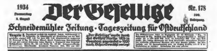
oben: Schneidemühler Tageblatt vom 11. Oktober 1896 mitte: Schneidemühler Zeitung vom 27.7.1917 (sage und schreibe: schon zu diesem Datum 70. Jahrgang!) unten: Der „Gesellige“ vom 2. August 1934, Schneidemühls auflagenhöchste Tageszeitung zu diesem Datum – 109. Jahrgang

2.) Im „Heimatbrief“ Nr. 4/18 Juli/August schwärmte ich im Erinnerungsspaziergang „Rüster Allee“ vom „Café Roland“, Rüster Allee