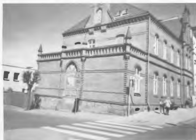
Unsere ehemalige imposante Post frühere Filehner Straße, dann Hermann-Göring-Straße. Sommer 2018