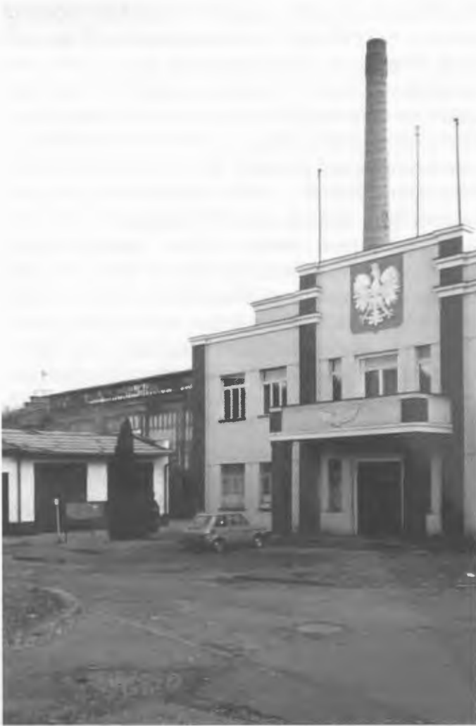
Blick zum Hauptgebäude RAW Schneidemühl, dem Sammelplatz am Fluchttag 25.1.1945, Werkstätten-Str. 8-9 und 10-12 in Schneidemühl.