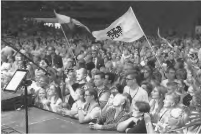
Blick in den Saal der Jahrhunderthalle

kamen über 6.000 Menschen durch die Einrichtung, das Konzert von Stefanie Hertel und ihrer Band beendete das Festival der deutschen Kultur am Abend. Die zu Beginn der Veranstaltung gelesenen Wünsche des Präsidenten der Republik Polen Andrzej Duda wurden bestätigt: „Die nächste Ausgabe des Festivals wird ein Ort des interkulturellen Dialogs und eine noch tiefere Entdeckung der Verbindungen sein, die uns einen.“