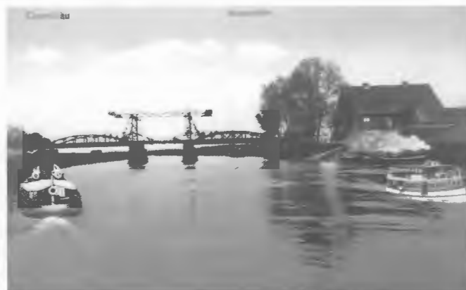
Eine romantische Brücke mit Ausflugsschiffen auf der Netze – ein kleiner Ausschnitt der anmutigen Umgebung Czarnikaus.