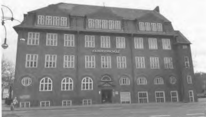
Haus der Volkshochschule, links EG unsere Heimatstube.

Liebe Leser, der Erhalt unserer Heimatstube und die Pflege des umfangreichen Archivs liegt uns, den Mitgliedern des Vorstands, natürlich sehr