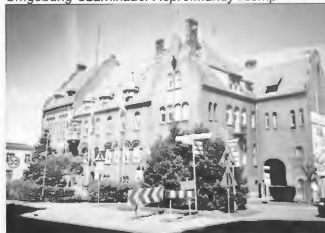
Das 1886 im Schinkelschen Stil erbaute ehemalige Landratsamt.