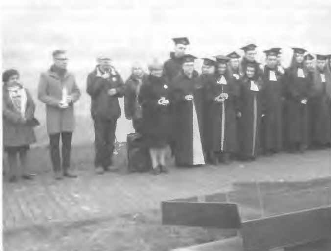
Am Gedenkstein auf dem Areal des früheren jüdischen Friedhofs mit Schülern der Gesamtschule Nr. 2 in festlicher Schulkleidung