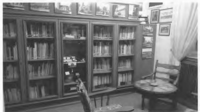
Der Bücherschrank in einem der drei Räume.