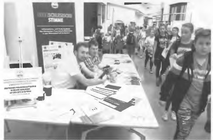
Infostände in den Wandelgängen

peln“, der auch hier zu sehen war. Im Kaisersaal präsentierte die Kindermusikgruppe „Przecinek“ (Das Komma) aus Brożec (Broschütz, Dorf südl. Oppeln, Deutsch als zweite Amtssprache) eine triadische Tanzperformance – bezogen auf die Ästhetik und Ideen des Bauhaus-Stils. Es gab auch Medien-, Theater-, Beatbox- und Loesje-Workshops - kreatives Schreiben, das „Cognitive Center“ der Halle hatte zum Bildungs-Kognitions-Erholungspfad eingeladen.