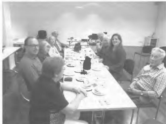
Herbsttreffen in Düsseldorf

und Hinweisen auf die Bundestreffen der Deutsch Kroner und der Schneidemühler. Es waren einige aktuelle Exemplare der Heimatbriefe und des Johannesboten ausgelegt. Wie immer trafen sie auf ein reichliches Interesse.