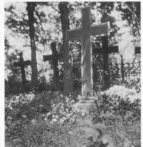
Rederitz, alter Friedhof.

Erstmals nach dem Kriege saßen wir bewirtet 1975 in einem abgeteilten Raum des