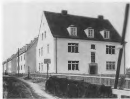
Schneidemühl: Die Koschützer Straße läßt grüßen. Die schmucken Häuschen sind allerdings auch älter geworden, und es sind auch noch einige hinzugekommen.

Zum Heimatabend hatte die Stadt wieder in die große Kugelbakehalle eingeladen, wo eine Show- und (gute) Tanzkapelle spielte. Obwohl diese Veranstaltung auch für die Öffentlichkeit freigegeben war, war die Halle bei weitem nicht besetzt, und die oft wenigen Tänzer – unter den übrigen Gästen waren einige ausge-