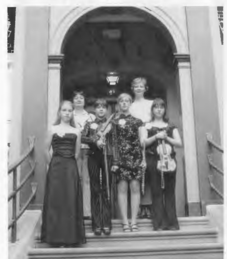
Das Kammermusik-Ensemble der Musikschule Piła.

Der Musikabend im Abendroth-Gymnasium wurde in diesem Jahr von der Gruppe „Ebbe und Flut“ bestritten – 3 Damen und 3 Herren mit Akkordeon und Gitarre, die ihre – teils selbstbetexteten – heiteren