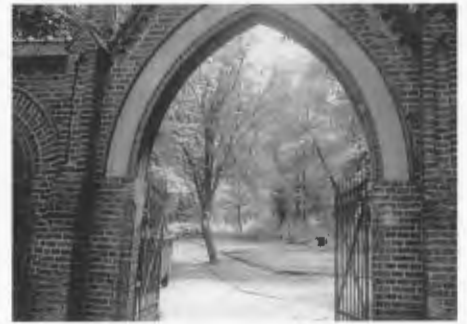
Deutsch Krone, Eingang zum katholischen Friedhof im Juli 2005.