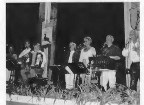
Die Gruppe „Ebbe und Flut“ beim Musikabend.

Dieser Tage bekam ich einen Anruf aus Lübeck. Es meldete sich eine Deutsch Kronerin, die hier in Rosenhof-Eicholz in einem Seniorenheim wohnt. Sie möchte so gerne noch einmal Deutsch Krone sehen, aber leider ist sie nicht mehr in der Lage,