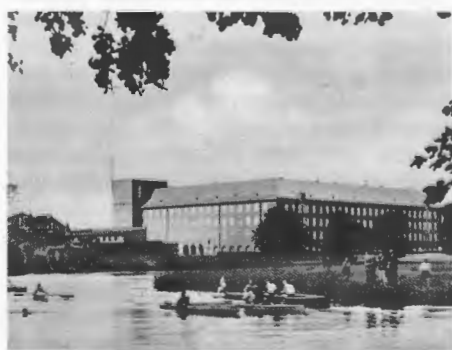
Boote am Regierungsgebäude.