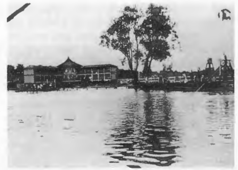
Flußbadeanstalt an der Küddow.