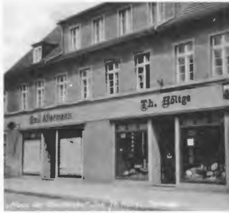
Das „Haus der Geschenke“ in Jastrow.