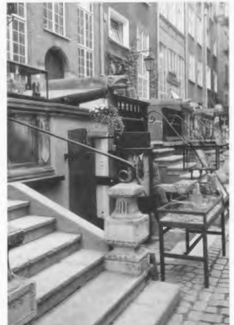
Danzig: Frauengasse mit Antik- und Bernsteinläden.

Die passierten Städte Thorn, Sensburg, Lötzen, vor allem das Lehndorffsche Gut Steinort hielten mir die deutlich sichtbaren Schäden durch den Zweiten Weltkrieg und/oder den teilweise gewollten Verfall in der Nachkriegszeit in schrecklich deutlicher Weise vor Augen. Dagegen vermittelten der Wiederaufbau der Marienburg und der Stadt Danzig, teilweise alte Idylle wieder herstellend, von Elbings Stadtkern in geglückter moderner Gestaltung, die gewaltige Nachkriegsleistung, ohne dabei den Irrsinn des Krieges, die deutschen und UNESCO-Hilfen vergessen zu machen.