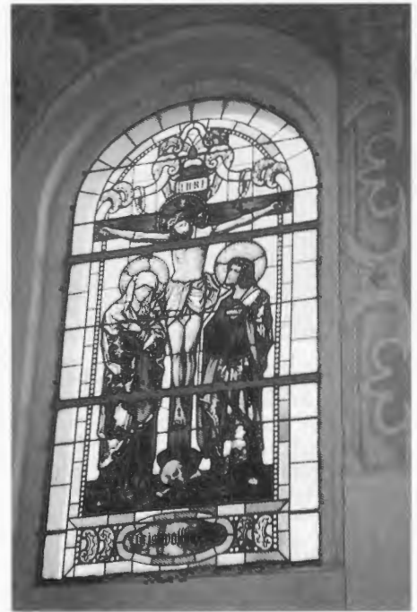
Altes Fenster in der Kirche von Rose.