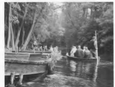
Staken auf der Kruttinna.