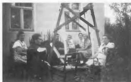
Die beliebte Schaukel in Jastrow im Sommer 1943.