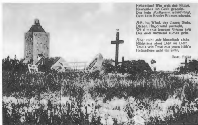
Ansichtskarte von der Insel Neuwerk aus dem Jahre 1929.

Heimatlos! Wie weh das klingt, Namenlos ins Grab gesenkt, Das kein Mutterarm umschlingt, Dem kein Bruder Blumen schenkt.