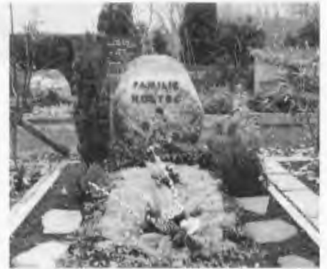
Grabstätte der Familie Höltge auf dem Friedhof in Bad Godesberg.