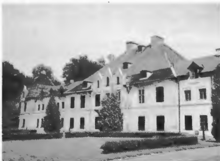
Steinort: Das seit Jahrzehnten verfallende Lehndorffsche Gutshaus.

Leider haben unsere Baustoffhandlungen auch mit ihren Gartenprodukten siegreichen Einzug auf dem Lande gehalten: Die farnefrohen Bauerngärten werden bereits deutlich sichtbar von pflegeleichten, mit Richt-Euch-Tuja-Hecken begrenzten Gartenanlagen zurückgedrängt. Dagegen wurde in dem kleinen Gotteshaus der Altgläubigen aus Rußland emigrierten in Eckertsdorf/Wojnowo, östlich Nieder die Zeit angehalten, der Krieg vergessen gemacht. Das Kirchlein wird von der Gemeinde intakt gehalten, obwohl deren Mitgliederzahl stark rückläufig ist, während das privat unterhaltene benachbarte Philipponenkloster nur noch zwei Nonnen beherbergt. – Die alte Försterei mit dem Geburtshaus Wiecherts in Kleinort ist ein Beispiel der gekonnten Investitionsinitiative deutsch-polnischer Zusammenarbeit und der auch im Museum von Sensburg festgestellten beginnenden Vergangenheitsbewältigung in Bezug auf die Wertung der ineinander verwobenen deutsch-polnischen Vergangenheit. Der Aufenthalt im „Hotel Mazuria“, direkt am Sensburger See, mit allmorgendlicher Badegelegenheit für Wasserhungrige, die große Dampfer-tour von Nikolaiken ließen die Schönheit dieser Wasserlandschaft empfinden.