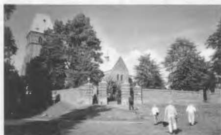
Der Dom in Ratzeburg.