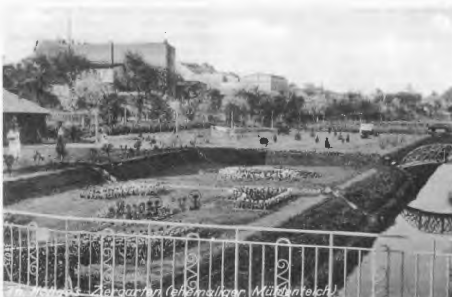
Jastrow: Theodor Höltges Ziergarten (ehemaliger Mühlenteich).