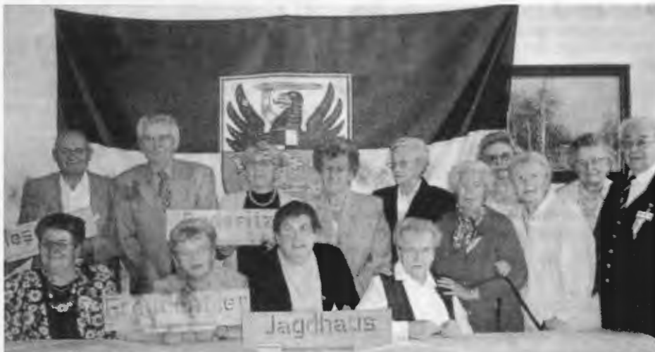
Zum 50. Male trafen sich Landsleute aus dem Kreis Deutsch Krone in Recklinghausen.