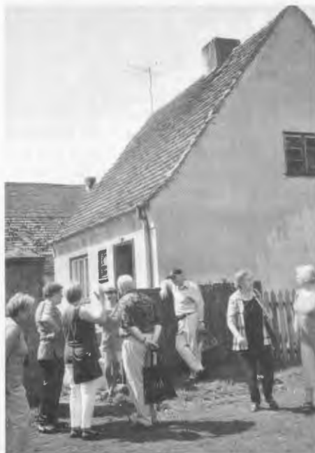
Die Reisegruppe von Rose.

An einem Tag wurde unsere Reisegesellschaft vom stellvertretenden Bürgermeister der Stadt Deutsch Krone anlässlich der in diesem Jahr stattfindenden 700-Jahr-Feier