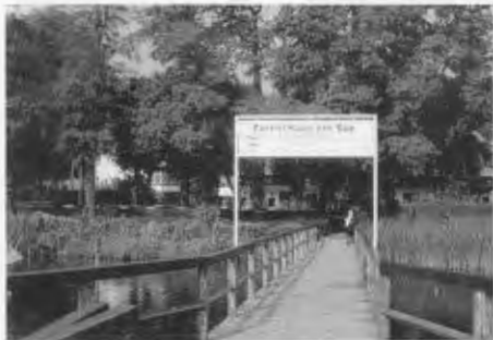
Hotel „Haus am See“ in Ferch.

Die Preise sind annehmbar, wir sind ja hier im Großraum Berlin; das Doppelzimmer mit Frühstücksbüfett kostet pro Nacht 72,- Euro, als Einzelzimmer 57,- Euro,