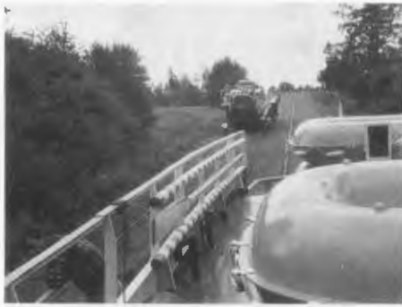
Auf einem „Rollberg“ des Oberländischen Kanals.

Die eindrucksvollste Fahrt auf dem Oberländischen Kanal, einem der drei Weltwunder Ostpreußens, eröffnete eine mir bislang unbekannte Technik von Schiffshebekunst. Von Buchwalde abwärts bis Elbing wurde unser kleines Schiff mit seinen 50 Passagieren mittels der alten, gut in Stand gehaltenen, vom Wasser angetriebenen Seilzugtechnik in den fünf Hebestufen auf Schienen über Land gezogen, um fast 100 Meter Höhenunterschied zu überwinden. Die Leistung wurde von den ansässigen Landwirten 1872 zum 50. Berufsjubiläum für Georg Jacob Steenke, dem Konstrukteur und Erschließer dieser Güterverkehrsstraße nach Elbing, auf einem Obelisk in Buchwalde an der geeigneten Ebene gewürdigt. Nach 1945 flachgelegt, haben wohl Touristen die heutigen Betreiber dieser Anlage genügend deutlich darauf aufmerksam gemacht, damit der Gedenkstein wieder aufgestellt wird, um auch heutige Besucher auf den genialen Erfinder hinzuweisen.