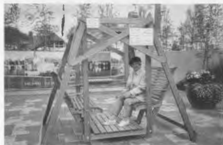
Die Schaukel auf der IGA in Rostock.

Erinnert Ihr Euch noch daran, daß in jedem Sommer in der Bahnhofstraße 2 vor dem Elternhaus meiner Mutter (Zimmermeister