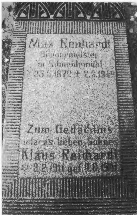
Die im September 2003 auf dem Friedhof in Perleburg gefundene Grabplatte.