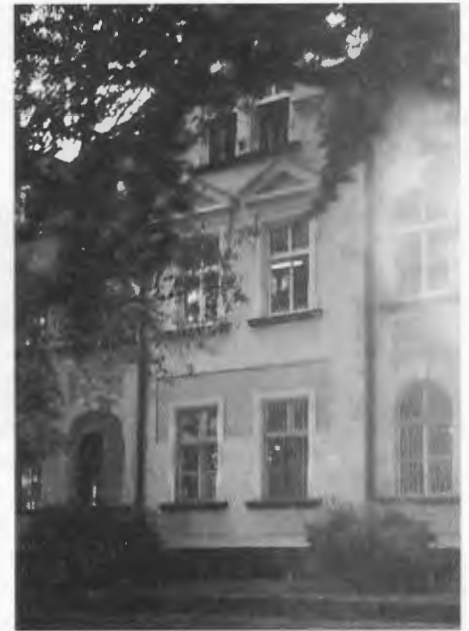
Das Haus Jastrower Allee 24 befindet sich in einem guten Zustand (Aufnahme von 1997).

Friedrichstein – ein Eisenbahnwärterhäuschen ist mir noch in Erinnerung –. Ganz in der Nähe war auch das Fließchen „Küddow“. Dort haben wir mehrere Tage unter schwerem Beschuß von den Russen im Wald zugebracht. Wir hatten ca. 20 Grad Kälte oder noch mehr. Bei schweren Verlusten haben uns die Russen überrannt. Dann haben wir uns bei Nacht und Nebel