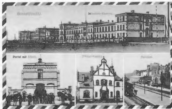
Diese Karte wurde am 11. April 1916 von Schneidemühl nach Bad Schwartau geschickt.