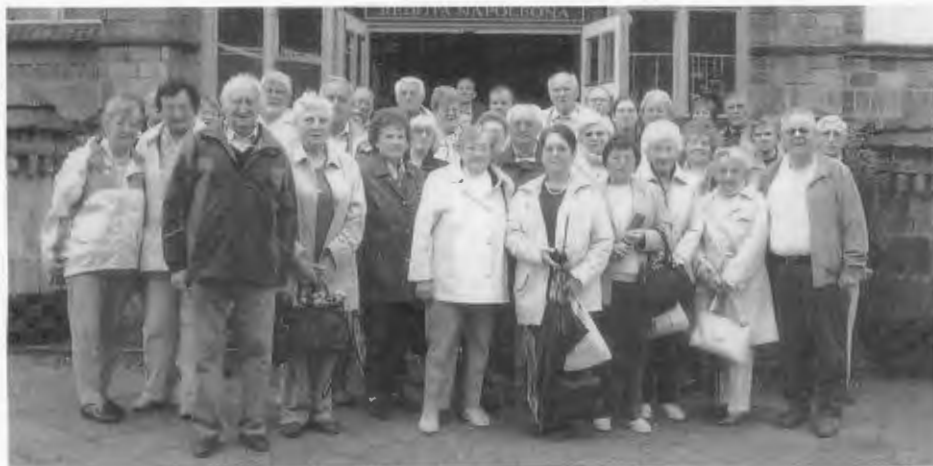
Die Teilnehmer an der Fahrt nach Märkisch Friedland.