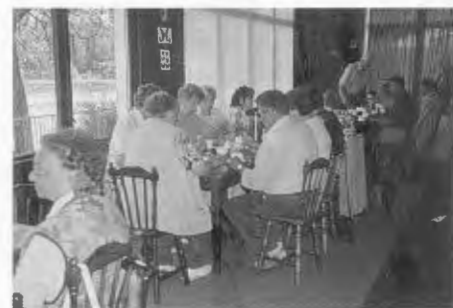
Jastrow: Frühschoppen im Waldseebad-Restaurant „George Washington“.