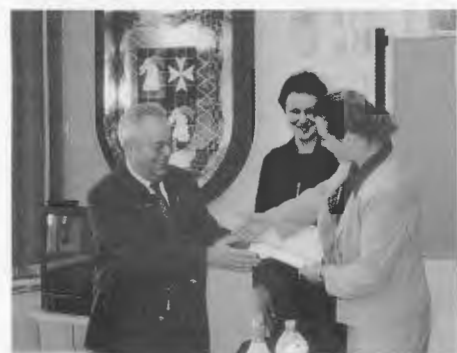
Märkisch Friedland am 12. August 2005: Übergabe der Spende an die Frau Bürgermeisterin.

Nach herzlichen Dankesworten und dem Wunsch, die Stadt möge doch endlich eine deutsche Partnergemeinde finden (meine Gemeinde Sickinge hat mit meiner Mithilfe schon seit 1996 eine offizielle Partnerschaft mit der Gemeinde Heerwegen-Polkwitz, jetzt Polkowice in Niederschlesien), hat die Heimatgruppe „Freunde Märkisch Friedlands“ eine Spende von 250,- Euro der Stadt für den Kindergarten übergeben. Hierüber war die Freude natürlich besonders groß. Beim nächsten Besuch wird die Direktorin des Kindergartens sich per-