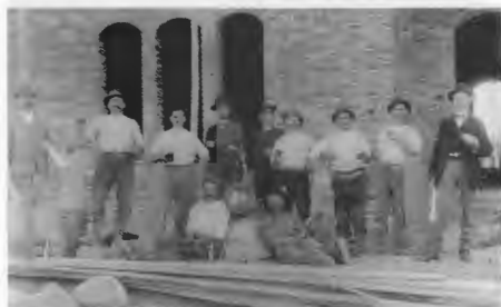
Bauarbeiter vor dem Rohbau der Zentralschule in Deutsch Krone im Jahre 1904.