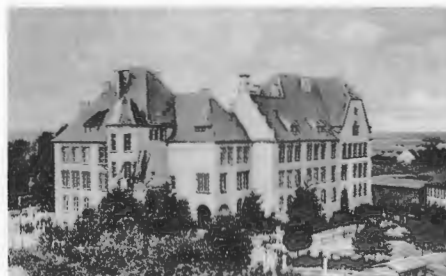
Die Zentralschule (Volksschule) in Deutsch Krone.