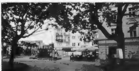
Schneidemühl, Bromberger Platz: Rechts war die Schmiede Dräger, links die Bromberger Straße und Krojanker Straße.