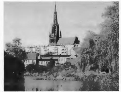
Demmin, Blick über den Schwanenteich auf die Stadt.