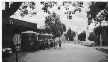
Das neue McDonald's-Restaurant auf dem Bromberger Platz in Schneidemühl.