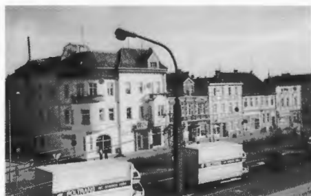
Jastrow, Berliner Straße zwischen Töpferstraße und Kleine Straße: Der Verkehr rollt und rollt.

Die folgende Kaffeestunde im Restaurant des Waldseebades hatten wir uns redlich verdient. Es folgte unsere sich jedes Jahr wiederholende Wanderung zur anderen Seeseite, zur Seemühle und zum Stauwerk.