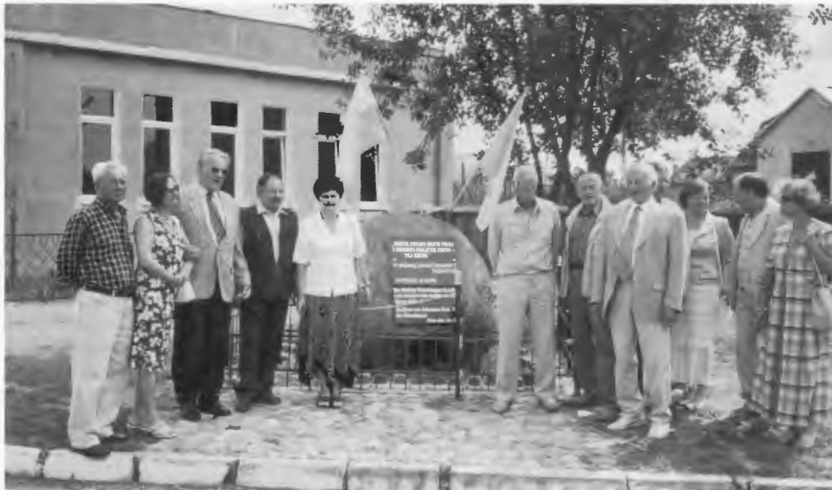
Arnshof am 31. Juli 2005: Nach der Einweihung des Gedenksteins mit der deutschen Inschrift.