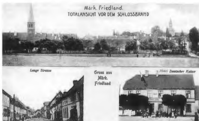
Märkisch Friedland: Alte Ansichtskarte vor dem Schloßbrand.