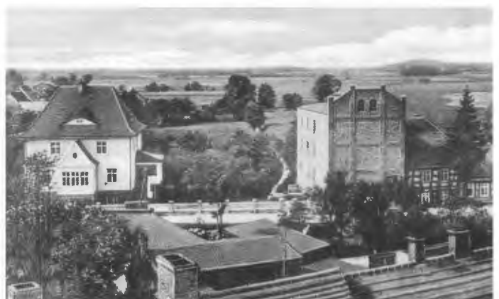
Märkisch Friedland: Schloßmühle (polnische Reproduktion).