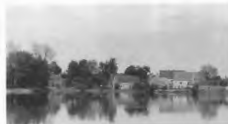
Doderlage, Blick aufs Dorf.