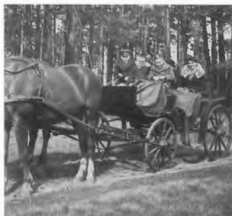
Kutschfahrt in den Tützwald.

An eine „Schlacht“ kann ich mich trotzdem erinnern. Es war eine Expedition außer-