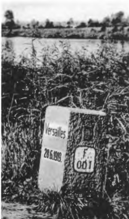
Zur Erinnerung im Juni: Grenzstein bei Königsblick mit der Inschrift „Versailles, 28.6.1919“.

Was hat uns Pfingsten heute noch zu sagen? Die allgemein in deutschen Landen zu findende Sitte, zu Pfingsten die Häuser mit Birkengrün zu schmücken, war auch in Pommern und in der Grenzmark verbreitet, wurde sogar mit noch mehr Liebe und Aufwand geübt als in den meisten anderen Teilen von Deutschland. Das mag daran gelegen haben, daß die Birke einen ihr besonders zusagenden Boden fand. Auch war sie die Begleiterin der meisten Kunststraßen, die man auch heute noch teilweise sehr bewundern kann. Auch an Feldwegen sowie in kleinen geschlossenen Wäldchen, die besonders in den Niederungsgebieten stehen, finden wir die leuchtenden Birken. So war es Brauch und Sitte, neben den Eingangstüren zu jedem Bauernhaus und selbst zu jedem Haus der Kleinstädter je einen Pfingstbaum zu errichten. Nicht genug damit, trugen auch die Fensterkreuze Birkenreisler. Und selbst in der Großstadtwohnung fehlte die Birke nicht, da sie zusammen mit Kalmus in einem riesigen Topf das Zimmer mit ihrem Duft füllte. Kurz vor dem Fest kamen ganze Wagenladungen dieser Bäume in die Städte, noch nicht im Kraftwagen, sondern mit dem Pferdefuhrwerk. Und an den Festtagen fehlte an keinem Pferdegeschirr der Bauern und