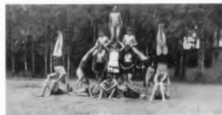
Ausflug der freiwilligen Feuerwehrjugend Schneidemühl ins Rohrtal (1936?). – Einsender: Karl Neumann, Hirschgraben 11, 23879 Mölln.

terstraße, Fernruf 23 55, zur Nachtzeit 23 62 oder nächste Polizeiwache, Fernruf 23 41 und 23 51 und bei Wasserrohrbrüchen an das Städt. Wasserwerk, Fernruf 23 55 oder nächste Polizeiwache, Fernruf 23 41 und 23 51;