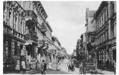
So schön sah es einst in Schneidemühl aus: Die Kleine Kirchenstraße mit ihren prächtigen Wohnhäusern.