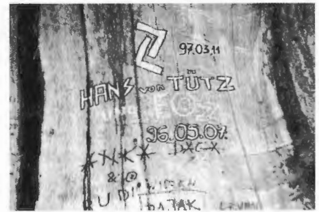
Im Stamm der alten Eiche hat sich ein Tützer verewigt. Wo wohnt jetzt der „Hans von Tütz“?

Wo große Stürme brausen am Berg mit voller Macht, hat wohl 600 Jahre sie für die Stadt gewacht.