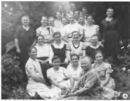
Die Schönen von Doderlage.