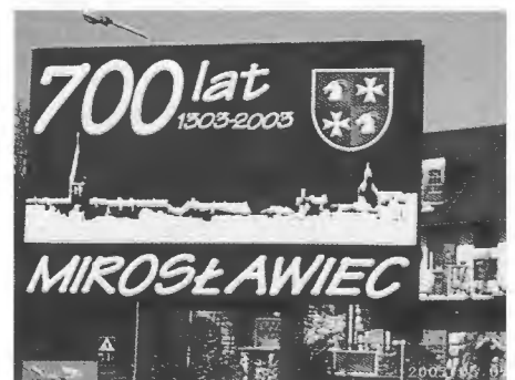
Offizieller Hinweis auf das Jubiläum.