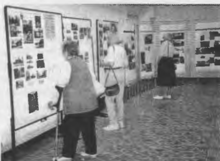
Blick in die Ausstellungen „Sanierung Demmins“ und „Deutsch Krone vor 1945“.