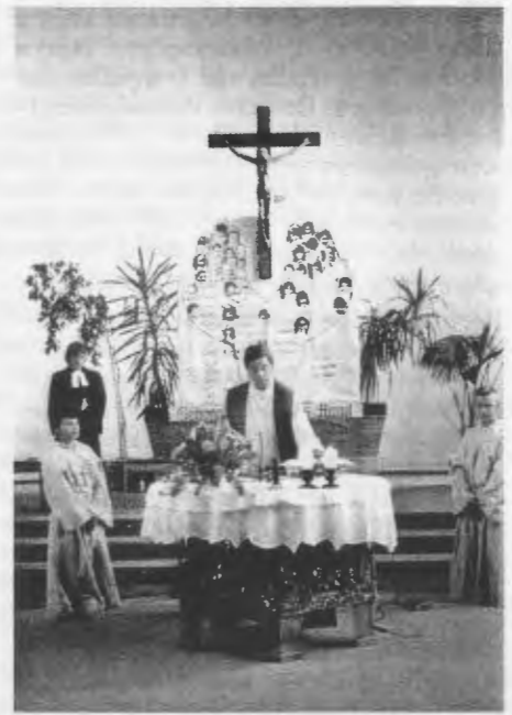
Ökumenischer Gottesdienst in der Sankt-Marien-Kirche.

Um 15 Uhr fand die Totenehrung mit Kranzniederlegung auf dem Friedhof Brockeswalde statt, an der auch die Gäste aus Schneidemühl teilnahmen. Pfarrer Merettig legte seiner Ansprache den Schriftwechsel zwischen den polnischen und den deutschen Bischöfen im Jahre 1965 und ihr Gemeinsames Wort vom 13. Dezember 1995 zu Grunde. 1965, anlässlich der bevorstehenden Millenniumsfeier zur Missionierung in Polen, hatten die polnischen Bischöfe ihre deutschen Brüder gebeten, ihnen wegen der Ereignisse in den vorangegangenen Jahren nicht gram zu sein und an den Feierlichkeiten in Versöhnung teilzunehmen. Die deutschen Bischöfe haben ihrerseits um Vergebung gebeten und die dargebotenen Hände ergriffen. 1995 haben beide Seiten in einem Gemeinsamen Wort daran erinnert, „daß die christlichen Werte wesentlich zur