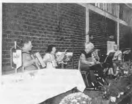
Musik zur Unterhaltung und zum Tanz.