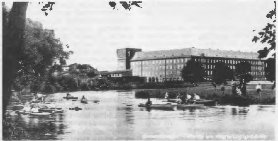
Waren dies die Süßwasser-Matrosen?

Als wir dann an Land kamen, die Ausbootung schnell – rucki-zucki – von stattem ging, gehörten wir zu den Letzteren und hatten den Anschluß verpaßt. Doch das mußte wohl so sein, denn an dem Denkmal von Fallersleben, an dem wir standen, kam gerade die Inselbahn zurück und lud zum Mitfahren ein. Dieses kannten wir noch nicht und setzten uns sofort hinein zu einer Rundfahrt von 40 Minuten durch das Unterland mit Panoramablick auf die lange Anna und mit Erklärungen. Es war eine sehenswürdige Fahrt, und wenn wir gesund bleiben, machen wir im nächsten Jahr die kleine Rundfahrt mit ins Oberland. Nach dieser Fahrt fuhren wir auch noch ins Oberland mit dem Aufzug und kauften nach einer Tasse Kaffee mit frischen Waffeln die zollfreien Zigaretten (Stange 16 Euro) ein sowie Seifen, Cremes und Rasierwasser. Auch Alkohol wird viel gekauft, pro Person ist eine Flasche erlaubt. Ich kaufte mir noch einen schönen Sonnenhut. So war die Zeit auch vorbei, denn um 16.20 Uhr legte das letzte Boot ab. So trafen alle wieder voll-