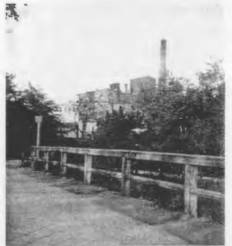
Blick von der alten Küddow-Brücke auf das Brauereigelände.