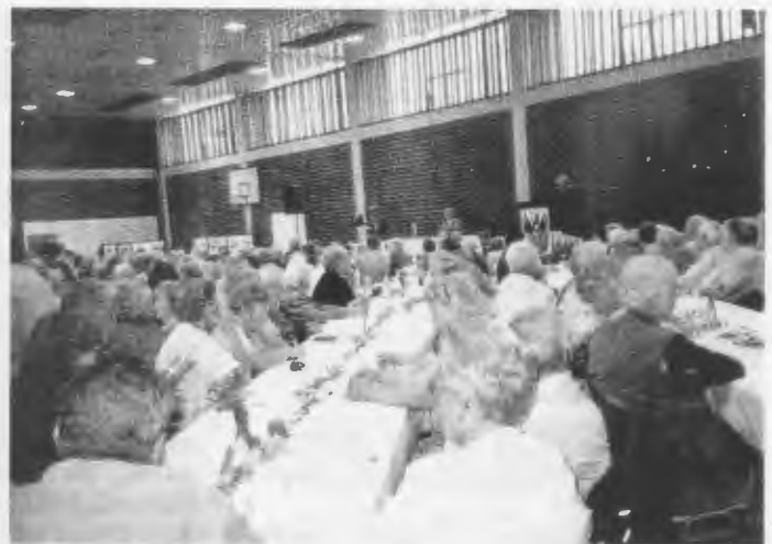
Blick in den Saal.

kreisgruppe. Er war es, der schon zu DDR-Zeiten, als jedes öffentliche Erinnern an die verlorenen deutschen Ostgebiete tabu war, die Verbindungen zu vielen Deutsch Kronern in der Umgebung Demmins hielt und heute zweimal jährlich Fahrten in die alte Heimat organisierte.