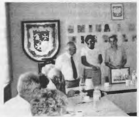
Empfang im Rathaus: Der Autor mit der Bürgermeisterin und der Dolmetscherin.

die Anlieger motiviert, auch an ihren Häusern etwas zu tun. So können wir hoffen, daß wir das nächste Mal eine etwas schönere Stadt vorfinden. Das gleiche gilt für die Dörfer der Umgebung, lediglich Balster und Alt Lobitz stechen etwas von dem Durchschnitt ins Positive ab, Alt Körnitz und Henkendorf auch, aber noch schlimmer ins Negative. Die Rundfahrt ging über Deutsch Krone, Tütz zurück nach Märkisch Friedland.