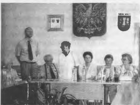
Empfang im Verwaltungsgebäude der „Gmina Walcz“ in Deutsch Krone.

Am Samstag dann eine Rundfahrt über Neustettin und Polzin zum Dratzigsee. Auf