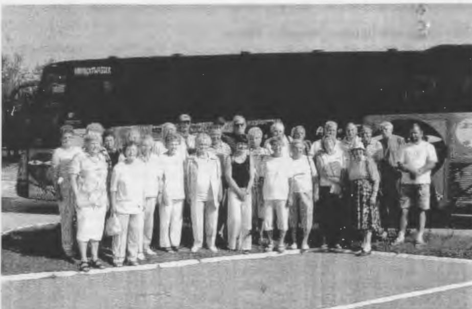
Fahrt-Teilnehmer in Alt Lobitz.

Um 8 Uhr am Sonntag, dem 10. August, war der Zeitpunkt zum Start für die Rückfahrt in unsere jetzige Heimat, diese Fahrt ging sehr zügig vonstatten, kaum Aufenthalt an der Grenze, unser Busfahrer hatte schon auf der Hinfahrt für die erforderlichen Unterlagen gesorgt, keine Paßkontrolle, und nicht einmal der Fahrer mußte aussteigen. Um 16.40 Uhr waren wir wieder in Hannover, und um 17.50 Uhr waren