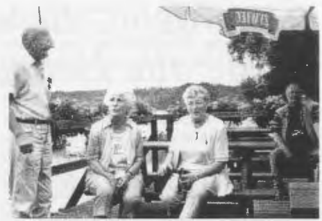
Am See in Neustettin.

Am Sonntag Abend war dann im „Rodło“ der Abschiedsabend mit Musik, Liedern und Sketchen. Ich glaube, daß es allen gut gefallen hat. Am Montag war für den Fahrer Ruhetag. Da es den ganzen Tag gereg-