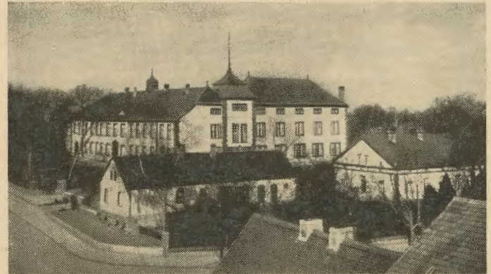
Die Hermann-Löns-Schule in Deutsch Krone (Staatl. Gymnasium), das außer Löns (1876 bis 1884) auch der Dichter Ewald v. Kleist besuchte.

Aber andere denken anders hierüber. Nach dem Kriege ist über die Frage, zu wem Hermann Löns eigentlich gehört, zum Osten, zu Westfalen oder Hannover, viel und eifrig gestritten worden. Man hat „unsere Löns“ gründlich unter die Lupe genommen, um seine eigentliche volkliche Gebundenheit herauszufinden. Für uns ein müßiger Streit. Die Niedersachsen wurden stolz auf Löns und nannten ihn „ihren“ Heidedichter, und die Westfalen machten Löns zum Sohn ihrer Heimat und zu einem „Landsmann“ ihrer Heimatdichter wie Josef Winckler, Margarete Windtborst, Lulu von Strauß und Torney, Adolf von Hatzfeld und andere. Westfalen darf mit Recht stolz sein auf die Reihe klangvoller Namen seiner Dichter, aber den Hermann Löns auch noch ganz und gar für