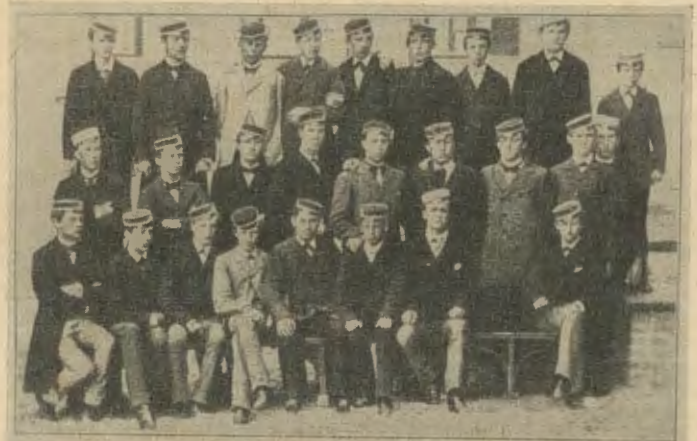
Hermann Löns als Bräutigam des 24. Staats-Gymnasiums im Jahre 1884

Löns ist als einjähriges Kind aus Kulm an der Weichsel, wo er 1866 geboren ist, nach Deutsch Krone gekommen. Hier wuchs er auf zwischen „Risch und Rohe“ bis 1884, bis sein Vater nach Münster versetzt worden ist.