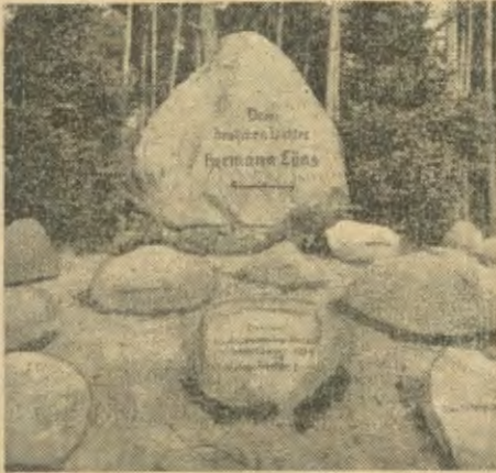
Das Löns-Denkmal in den Sagemühler Fichten. Es wurde vom Arbeitsdienst errichtet. Die einzelnen Findlingssteine bezeichnen jeweils ein Löns-Buch.

Die heimische Landschaft hatte es ihm angetan Löns als Biologe