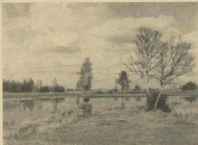
Das „Fahle Bruch“ bei Deutsch Krone

Ganz allein ging Hermann. Noch einmal besuchte er all die stillen Plätze, wo er so oft geweilt hatte. Noch einmal hörte er das Klatschen der Wellen am Ufer des Stadtsees, stand am Rande des „Fahlen Bruches“, träumte eine Weile am schla- fenden Radunensee, hielt wortlose Zwiesprache mit den Riesen des Buchwaldes und im Klotzow, schaute mit