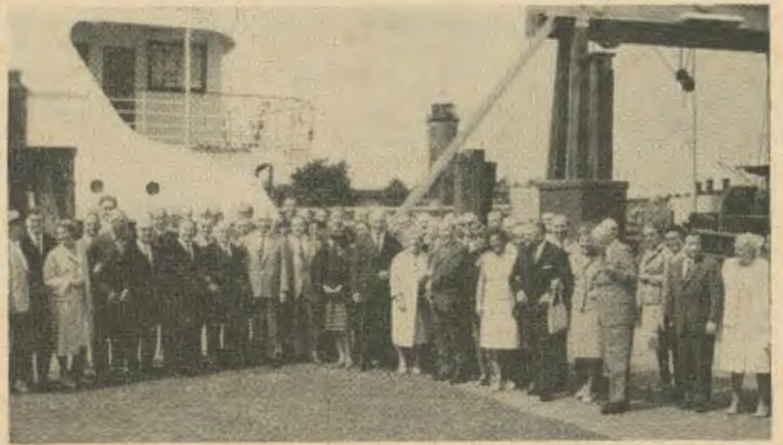
Vor dem Fährschiff „Wiking“