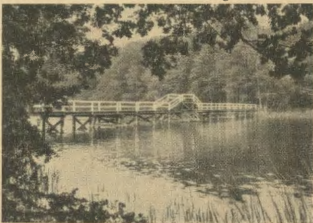
Die Klotzowbrücke im Deutsch Kroner Buchwald

sen wären als ein nach westdeutscher, überheblicher Denkungsart gleichgültiger Landstrich irgendwo dahinten in der „kalten Heimat“? Wir dürfen diese Frage getrost mit einem klaren „Nein“ beantworten. Man vertiefe sich doch einmal ganz objektiv und ohne einen Anflug von Heimatromantik in Naturschilderungen und Tiergeschichten unseres Hermann Löns. Man fühlt ja oft geradezu wie von selbst heraus, welche Gegend er gemeint haben muß. Und welche Schönheit steckt in seiner Prosa! Wer ein wenig Sinn hat für poetische Schlichtheit und stilistische Gewandtheit, für den ist es ein hoher Genuß, in Löns' naturbeschreibenden Büchern Beobachtungen und Gedanken in einer vollendeten Form der Darstellung zu finden, die wohl immer einmalig bleiben wird. Wer in seiner Jugend die Umgebung von Deutsch Krone durchstößt hat, dem zwingt sich geradezu die Ueberzeugung auf, daß Löns, wenn er nicht das Glück gehabt hätte, in Deutsch Krone aufzuwachsen, niemals einen so durchaus originalen Charakter seiner Natur- und Tierdichtung hätte entwickeln