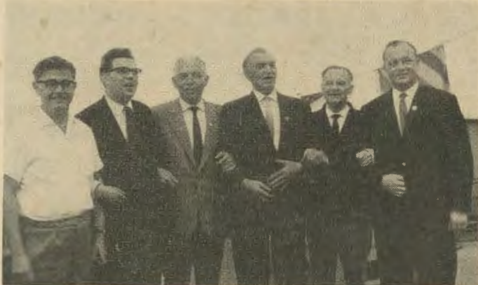
Arm in Arm mit den Paten