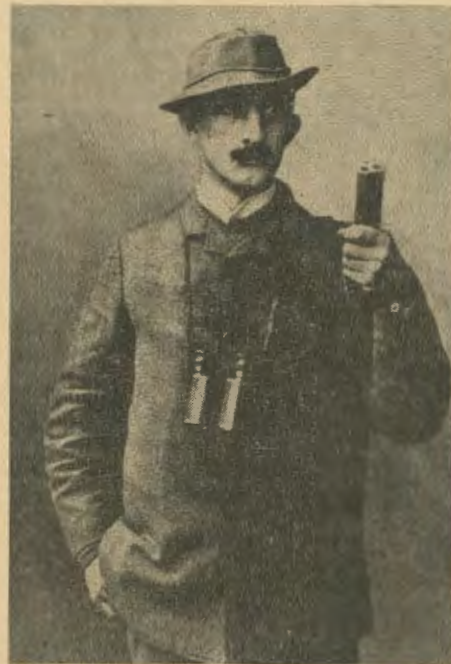
Zum 50. Todestag unseres ehem. Deutsch Kroners Hermann Löns. (Näheres im Innern dieser Nummer).

die in jener Zeit in Schlesien eingetretene „Desorganisation“ als charakteristisch für das polnische Volk und als dauerhaft betrachtet, obwohl es sich nur um vorübergehende Erscheinungen gehandelt habe. Sie hätten die Vorgänge nämlich „durch die Brille ihrer im Ausland angenommenen Betrachtungsweise und Gewohnheiten“ angesehen. Die polnische Publizistin rügt also, daß die polnischen Alt-Kommunisten eben auf Grund ihrer Einstellung zur internationalen Arbeiterbewegung die Austreibungen als Verstoß gegen die Prinzipien des Sozialismus betrachteten.