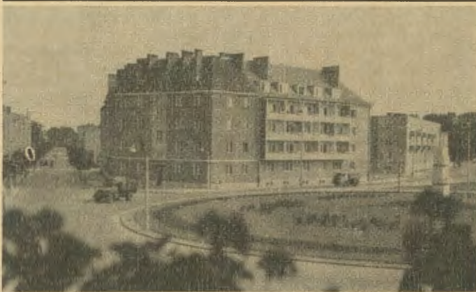
Neueste Aufnahme vom Sternplatz

Zwar sind Besuchsreisen für die Zonendeutschen wesentlich erleichtert; wer aber aus dem Westen einreisen will, der muß erhebliche Schwierigkeiten überwinden und mancherlei Voraussetzungen erfüllen. 30 DM pro Tag und Person müssen in Sloty eingewechselt werden, und das zu dem amtlichen Kurs; denn der polnische Staat braucht Devisen. Wer dann von Posen kommend auf dem Schneidemühler Bahnhof eintrifft, wird hier kaum Veränderungen feststellen. Ihn grüßen die alten Geleise, die alten Gebäude, zwar etwas erneuert und neu angestrichen, aber es ist wie früher. Schaut man sich aber bei den Mitreisenden um, dann fällt man sofort auf, trotz Übernachtigung und Verschmutzung durch die Reise. Die Leute sind ärmlich gekleidet und machen einen fast stumpfsinnigen Eindruck. Man kann sogar ein Taxi bekommen, hat aber dann das Gefühl, in einem gerade vom Schrottplatz erworbenen Wagen zu sitzen.