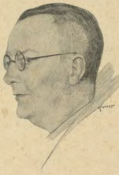
Franz Schauwecker †

Er war der soldatische Schriftsteller aus Deutsch Krone in den Stahlgewittern des 1. Weltkrieges