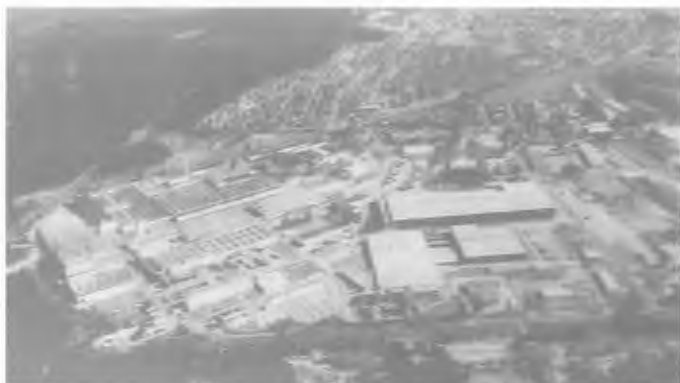
Die FEA-Werke, Selgenauer Str. um 1943.

Nachgefolgten und die folgenden Generationen getan.