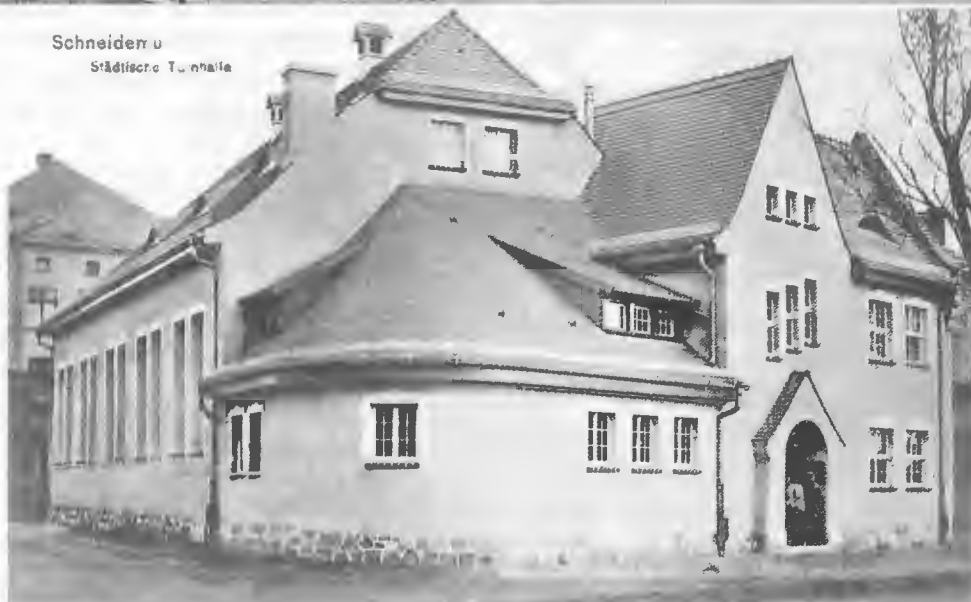
Schneidemühl Städtische Turnhalle

Handelslehranstalten, Posener Straße (oben) und Städt. Turnhalle, Milchstraße 18 (unten)