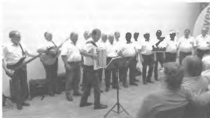
Der Shanty-Chor in der Bürgerhalle