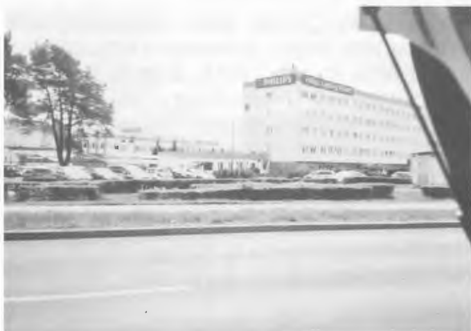
Die ehem. FEA Werke, Selgenauer Str. heute 2018. Im Foto das 1979 neu erbaute moderne Haupteingangs-Gebäude für Vertrieb, Verkauf und Verwaltung. Foto: Gerhild Haase, Sommer 2018

So sind die eben genannten Presse-Organe mit jedem erschienenen Exemplar im Bundeszeitschriften-Archiv Berlin für immer aufbewahrt. Ich habe immer an die Macht der Sprache und des Geschriebenen geglaubt, aber nur unter der Voraussetzung der Wahrheit, denn wer nicht in Wahrheit zurückblicken kann, wird auch nicht nach vorne blicken können.