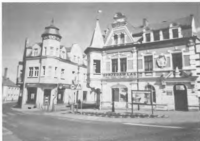
Beeindruckende Kaufmannshäuser am ev. Kirchplatz.