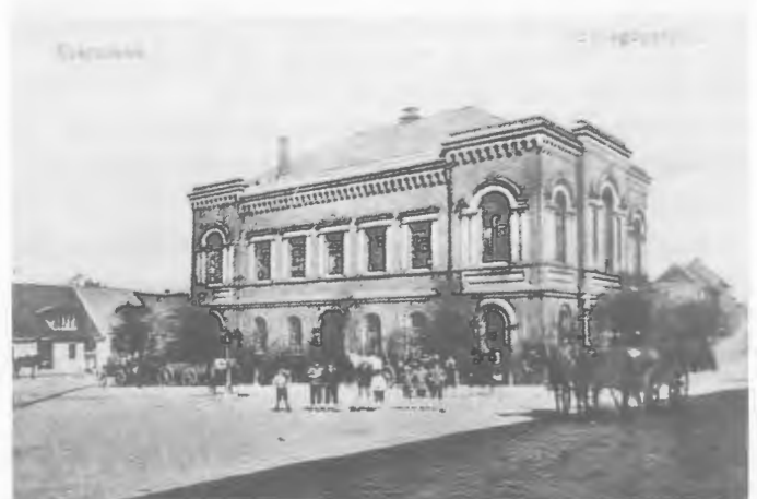
Die Synagoge auf dem ehem. Synagogen-Platz.