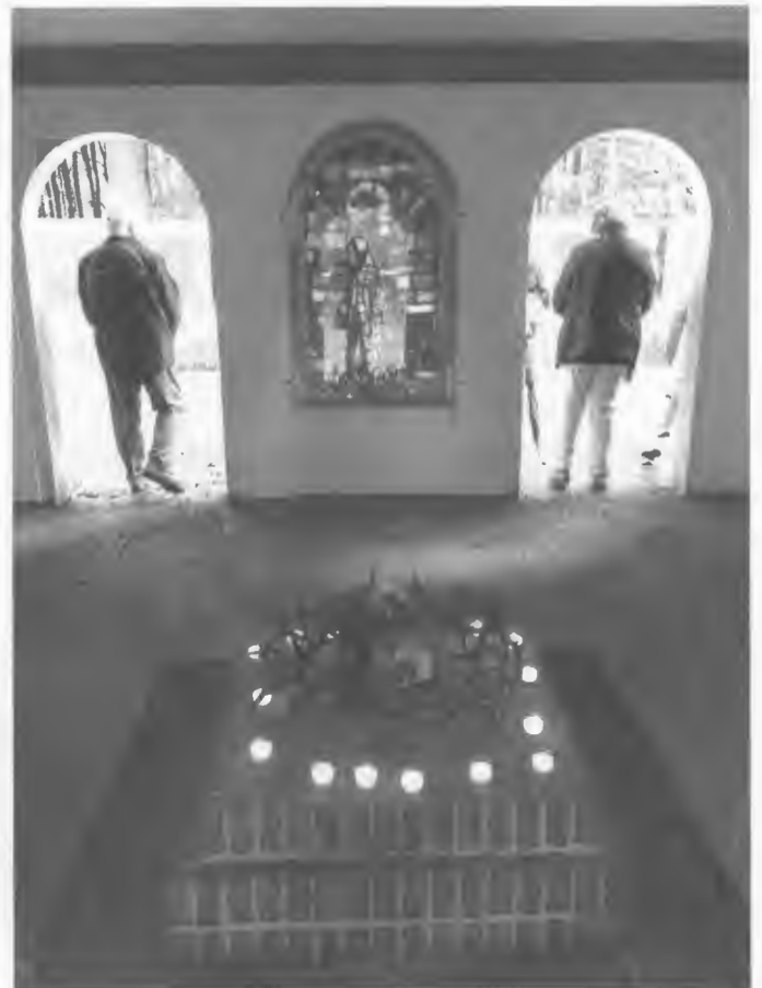
Kapelle in Brockeswalde.