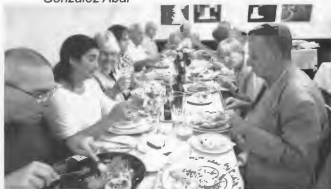
Ratskeller Oterndorf.