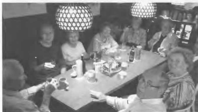
Gesellige Runde im Hus op'n Diek

Zurecht erwarten die Leser einen Bericht vom diesjährigen Heimattreffen in Cuxhaven. Die weitaus meisten Heimatfreunde sind leider nicht mehr in der Lage das Treffen zu besuchen, das zeigte sich in den letzten Jahren auch schon sehr deutlich. Zu diesem Treffen kamen noch 26 Personen, allerdings waren