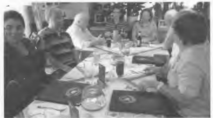
Im Hus op'n Diek.