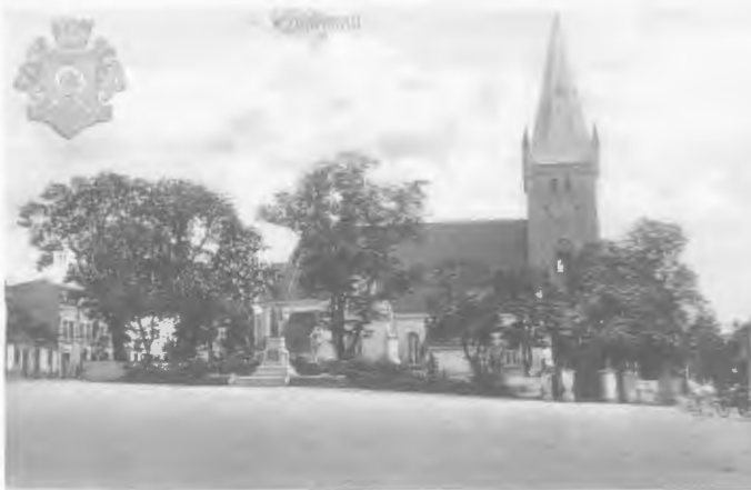
Die kath. Kirche mit dem Kaiser-Wilhelm-Denkmal davor

Hölzer und der Fertigfabrikate standen 3100 m eigene RB-Anschlüsse zur Verfügung. Um einigermaßen eine Vorstellung von diesem riesigen Betrieb und seiner Produktion zu haben, nenne ich außer der inländischen Holzbeschaffung die Zahl von jährlich rund 150.000 Kubikmeter ausländische Holzeinfuhr! Die Zahl der Beschäftigten war Anfang des Jahres 1939 auf 2300 gestiegen. Besonders erwähnenswert sind die gut ausgerüsteten Sozial-Einrichtungen, wie z.B., um nur einige zu nennen, eine DRK-Arzt-Station, zwei hochmoderne Küchen, eine vorbildlich eingerichtete Lehrlingsausbildung, mit eigener betrieblicher Berufsschule (was zu damaliger Zeit noch keine Selbstverständlichkeit war!) und zwischen allen Bauten gepflegte Grünanlagen.