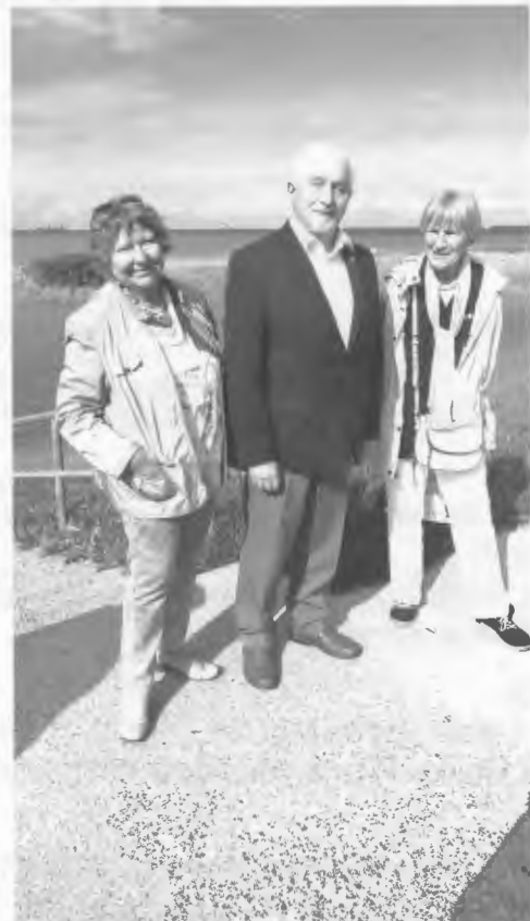
Am Deich.