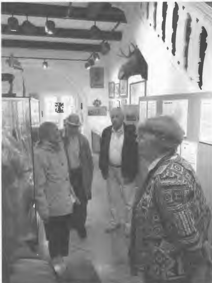
Heimatstube Labiau in Otterndorf.