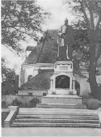
Das Kaiser-Wilhelm-Denkmal vor der kath. Kirche.

riesigen Wiesen veranlassten die Scharnikauer zur intensiven Rinderzucht. Die Tiere wurden nach ganz Pommern und Brandenburg geliefert und dazu die Schafzucht in großem Ausmaß betrieben, die der Stadt gute finanzielle Mittel erbrachten. Weber kamen aus Schlesien und produzierten Stoffe und 1725 gab es schon 2 Tuch- und Färberfabriken, die ihre begehrten Produkte in ganz Pommern verkaufen konnten.