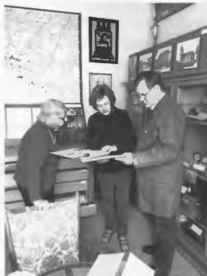
Eine Originalausgabe der „Grenzwacht“ von 1941 wurde eingepackt

den 5-türigen Vitrinenschränken, die Fächertafeln mit Bildern, sowie das Mobiliar.