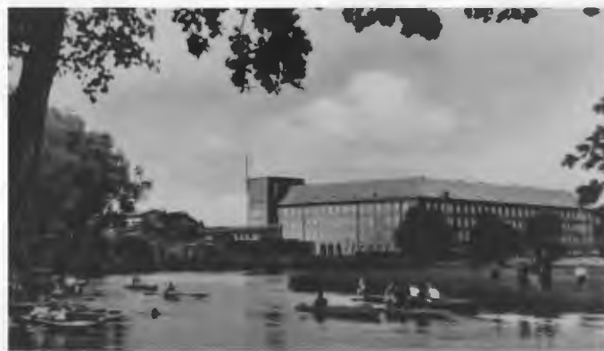
Das Gewimmel der vielen Ruder- und Padelboote vor dem Regierungsgebäude damals zu unserer Zeit, wie auch heute 2019!

kehrte. Bitte in der Repro die Schneidemühl-Fahne beachten. Ein Tag ohne Ruder- und Padelboote auf der Küddow – ausgenommen im harten Winter – gab es sonst zu keiner Jahreszeit und immer unter größter Zuschaueranteilmahme der Schneidemühler und besonders im Sommer auch der vielen Gäste aus dem ganzen Reich! Nach Gründung des Schneidemühler Sportvereins 1872, dem Radfahrclub 1890, wurden 1905 die ersten 2 Rudervereine gegründet mit den Namen „Germania“ und „Viktoria“ und dafür die ersten Landungsplätze angelegt mit noch sehr einfachen Überdachungen für die Boote. Dank der Aufmerksamkeit und großer Unterstützung des Schneidemühler Magistrats entwickelte sich durch großzügige kommunale finanzielle Zuwendung diese Sportart bald zu einem ansehnlichen Sportzweig.