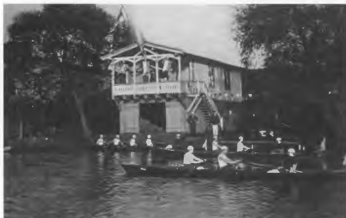
Bootshaus des Schneidemühler Rudervereins Germania, 1929

Der Wassersport hatte in Schneidemühl eine wahrhaft riesige Popularität und wie die Annonce aus der Schneidemühler Tageszeitung „Die Grenzacht“ vom 20. März 1936 aussagt, hatten breiteste Bevölkerungsschichten großes Interesse an den schönen Darbietungen und dem Miterleben der Erfolge. So waren die Schneidemühler stolz, dass eine Auswahl aus allen Rudervereinen der Stadt nach hartem Training an den Olympischen Spielen 1936 in Berlin teilnahm und mit Erfolg in ihre Heimatstadt zurück-