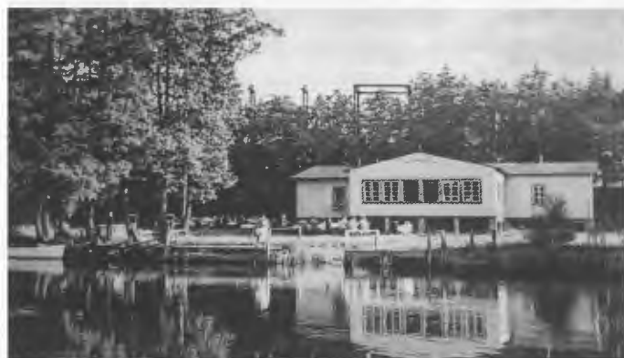
Bootshaus der „Marine- und Schutztruppen Kameradschaft 1941

Eine hohe Anzahl aktiver Vereinsmitglieder hatte der „Ostmärkische Regatta-Verein“ und besonders der „Ruderverein der ehemaligen deutschen Kriegsmarine und der Kolonial-Schutztruppen Kameradschaft“, letzterer mit einem aktiven Kern, der an allen Wettkämpfen und auch an den Olympischen Spielen 1936 in Berlin teilnahm. Sie alle hatten viele Schneidemühler Sympathisanten, die den Rudersport als Hobby hatten und immer, ich betone immer,