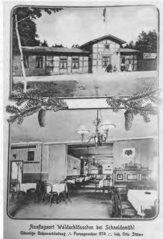
Das ehem. so schöne „Waldschlösschen“, dicht bei Schneidemühl auf dem Wege nach Küddowtal (Netzekreis!)

Experten werteten die in die Natur integrierte geplante Anlage als vollen Erfolg (auf den Seiten 15 bis 18). Alle diese Träume sind für unsere Heimatstadt für immer vorbei, weiter kein Kommentar dazu! So, wie ich bisher jede meiner Arbeiten immer unter ein Motto gestellt habe, handele ich auch heute mit den Worten von D. Bonhoeffer: „Von guten Mächten wunderbar geborgen, erwarten wir getrost was kommen mag. Gott ist mit uns am Abend und am Morgen und ganz gewiss an jedem Neuen Tag.“ Wörtliches Zitat aus seinem Nachlass.