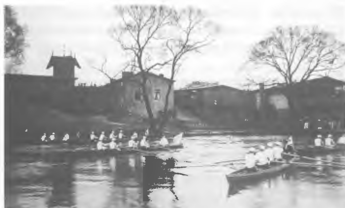
„Anrudern 29.3.1933“ An den Ufern, Bootshaus an Bootshaus

dow-Schleife immer große Achter und kleine Vierer Ruderboote trainierten, begleitet von vielen Paddelbooten – wie auf der Repro unübersehbar zu erkennen ist! Erwähnenswert, weil sehr erfolgreich, war der Ruderverein des „RAW“ (Reichsbahnausbesserungswerk), sein Landungsplatz befand sich auf dem rechten Ufer der Küddow, hinter den riesigen ehemaligen Bahnwerkstätten, nicht weit von der Bahnstrecke Schneidemühl, Dirschau/Danzig entfernt. Alle Schneidemühler Rudervereine hatten einen großen, sportbegeisterten Personalbestand und erfüllten ihre Passion mit ehrlicher Hingabe.