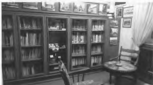
Diese Vitrinen mit Aufbau hatten es in sich

de zusammen um die ungeliebte Arbeit zu leisten. Erschwerend kam hinzu, dass der bisherige Büroraum mit seinen Vitrinen, Schränken und den Bilderwänden zukünftig nicht mehr zur Verfügung stehen wird, da er als Fluchtweg für den dahinter liegenden Flur gebraucht wird. Es galt zu reduzieren und ein neues Bestandsverzeichnis anzulegen.