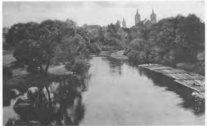
Unsere liebe alte Küddow als „Transportmittel“. Rechts im Bild die km-langen Holzflöße und dahinter grüßen die Türme der kath. Johannes- und der ev. Stadtkirche 1915.

den unermesslichen Holzreichtum um Schneidemühl, in den Jahren der Industrialisierung entstanden dann an den Ufern der Küddow mächtige, moderne Mühlen, Holzverarbeitungsbetriebe, aber auch ein E-Werk und viele Brücken.