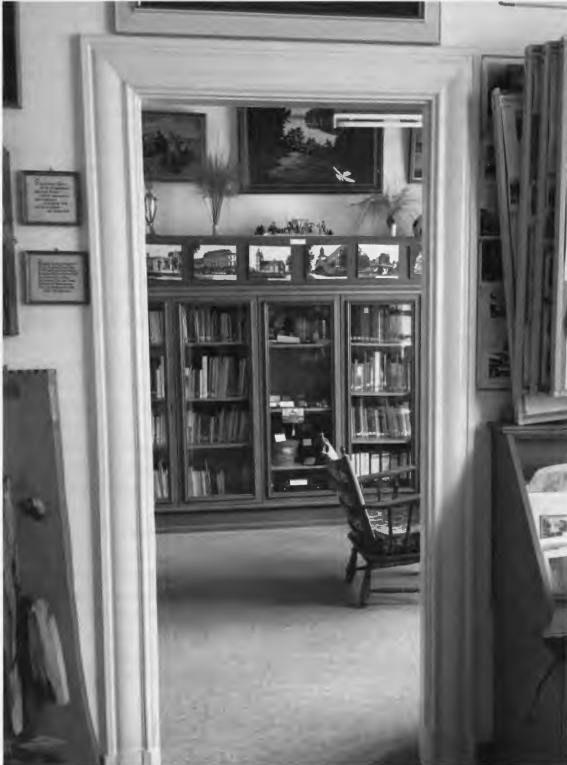
Unsere Heimatstube in Cuxhaven vor der Gebäudesanierung