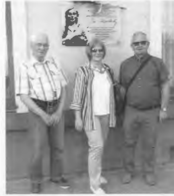
Die Deutschlehrerin mit Vertretern der DSKG und der Freunde der Stadt Pila unter der Gedenktafel.

Was ist passiert bei uns in Schneidemühl?