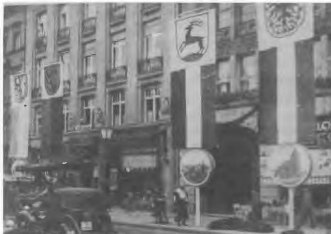
Die Unterkunft der Auswahl der Schneidemühler Rudervereine in Berlin-Charlottenburg, Hardenberg StraÙe zur Olympiade 1936. Die Schneidemühler Fahne deutlich sichtbar.

für die Gründung von Schneidemühl, rechts und links der Küddow. Und nach meiner heutigen kurzen Schilderung der wirtschaftlichen, dann später industriellen Entwicklung stellt sich nun auch die Frage, ob es bei der sehr langen und idealen Flusswasserlage durch die Stadt auch Wassersport gab? Ganz natürlich ist diese mit einem vollen „JA“ zu beantworten.