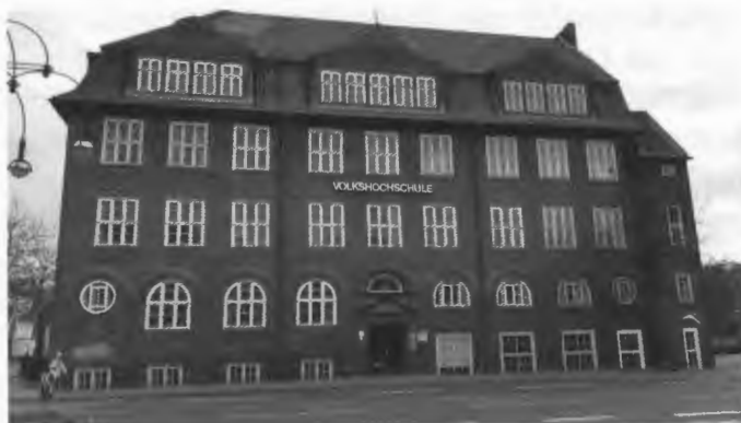
Das Gebäude mit unserer Heimatstube wird renoviert

Jedoch für einen längeren Zeitraum müssen