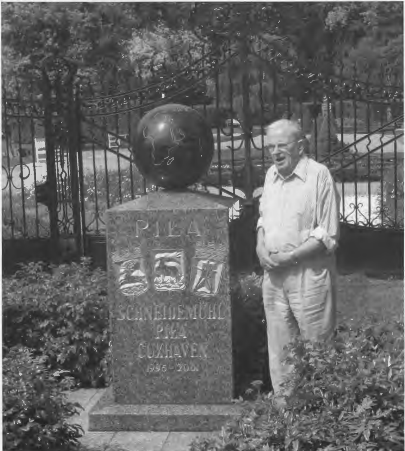
15 Jahre Schneidemühler Gedenkstein in Pila

11. Jahrgang, 2. Ausgabe März/April 2016