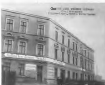
Hotel und Gasthof „Weißer Schwan“, Brauer Straße 1929

Unser nächstes Ziel ist eine weitere gastronomische Perle, aber wieder ganz anderer Art, bekannt und beliebt bei allen Schneidemühlern - ob Alt oder Jung: Das herrliche „Waldrestaurant Königsblick“. Unser Rückweg vom Restaurant Eichberg führt uns wieder zum Bromberger Platz, von dem aus wir die ständige Omnibusverbindung nach Königsblick durch die Brauer Straße gerne in Anspruch nehmen. Als Erstes vorbei an der markanten, in edlem roten Klinker erbauten Luther Kirche, dicht am Küddow-Ufer. Für mich immer wieder - nun auch nach 70 Jahren besonders tief bewegend, weil ich in ihr 1944 konfirmiert wurde und trotz der Fluchtheftik des 25.1.1945 meinen Konfirmandenschein mit dem Foto der Lutherkirche gerettet habe. In der Brauer Straße auf dem Wege nach Königsblick, möchte ich noch 2 gastronomische Einrichtungen - wenn diese auch nicht so repräsentativ sind, wie die von mir beschriebenen in den voran erschienenen Folgen 1-5 - nicht unerwähnt lassen: Einmal das dreistöckige Hotel „Zum Weißen Schwan“, im Schneidemühler Branchenbuch von 1925 als „Fremden-Logis“ mit warmen und kalten Speisen und ab 1933 als Hotel ausgewiesen.