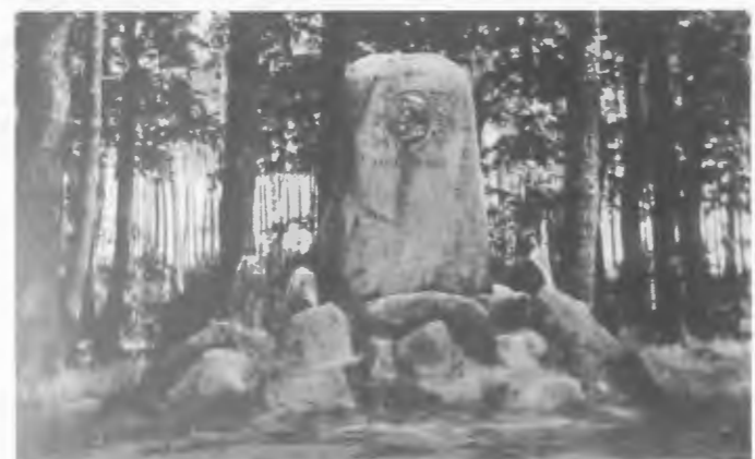
Der gigantische Findling mit dem Relief Kaiser-Friedrich-Wilhelm III.

Bevor wir uns aber im Geiste noch einmal in die exzellente gastronomische und räumliche schöne Atmosphäre vergangener Zeit hineinversetzen, möchte ich nicht ehrendes Gedenken vergessen an den heldenhaften Einsatz der Verteidiger in den Wäldern um Königsblick, die den überhaupt 1. Angriff der Bolschewisten in den letzten Januartagen 1945, unsere Heimatstadt im Sturm einzunehmen, verhinderten. Mit übermächtigen Panzer- und Artillerie-Divisionen wollten sie Schneidemühl einnehmen. Die erfolgreiche Abwehr von Wehrmacht und Volkssturm bei Königsblick ermöglichte in der Folge noch tausenden von Frauen, Kindern und Verwundeten die Flucht und damit dem sicheren Entrinnen vor Vergewaltigung, Qualen, Verschleppung und Tod. Der Blutzoll war auf beiden Seiten hoch. Ehre unseren Männern, die in gutem Glauben ihr Leben für Andere hingaben!