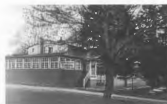
Ansicht der verglasten Veranda, „Wald-Restaurant Eichberg“ 1935

biegen dann den immer pulsierenden Bromberger Platz passierend links in die Eichberger Straße ein. Warum unser erstes Ziel das im Foto zu sehende Waldrestaurant in dieser Straße ist, das wunderschön nun schon mitten im Wald liegt, hat seinen Grund in dem großen Spezial-Wild-Speisenangebot. Die Lage dieses Ausflugsrestaurants ist deshalb so romantisch, weil sich früher hier einmal das Forsthaus Eichberg befand und das sagt ja eigentlich alles aus! Alleine der Weg dorthin ist märchenhaft, deswegen muss ich ihn einfach erwähnen. Die Küddow fließt ganz dicht an der Straße entlang, macht hier wahre Natur-Pirouetten, die Wiesen von einem unbeschreiblichen Grün, auf denen sommerabends ein großes Konzert von hunderten Fröschen stattfand. Wir bewundern beim Spazieren den bemerkenswerten Eingang mit der herrlichen Baumallee des Friedhofes zur Feierhalle und dann das große Geviert des Stadtgutes Margaretenhof mit seiner Spezialität der Gänsezucht, deren Produkte über Schneidemühl hinaus sogar bis in die Delikatessen-Geschäfte der Reichshauptstadt geliefert wurden. Von diesem Standpunkt aus sehen wir über die Küddow hinweg die mächtigen Baumkronen der Jastrower Allee und in der Ferne die vielen Kirchtürme unserer Heimatstadt. Von diesen Blicken tief bewegend erfüllt, empfängt uns dann die ganz besonders gastfreundliche Atmosphäre im „Waldrestaurant Eichberg“.