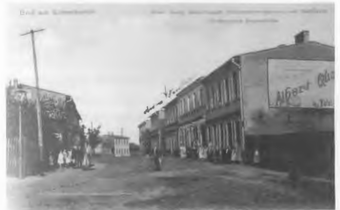
Gaststätte, Kolonialwaren und Destillation Gusig 1930

von sauren Gurken und Salzheringen in dickbauchigen Holzfässern, Landschinken, Landbrote und Landspeck, alles was der Mensch zum Leben gerne aß. Aber Zweitens berühmt durch die eigene Branntwein-Destillation, (sogar auf alten Ansichtskarten ausgewiesen!) in einer selten anzutreffenden, geschmackvollen Angebotsbreite, speziell Pommersche und Ostpreußische Schnäpse.