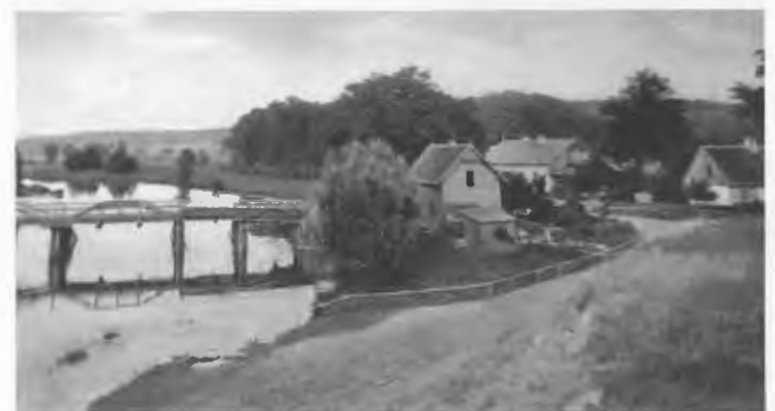
Blick auf das schöne Königsblick, noch mit der romantischen Holzbrücke und den Forsthäusern 1914