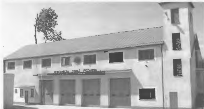
Oben: Die neue Feuerwehr-Wache am alten Platz in Usch