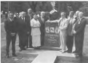
Die offiziellen Vertreter der Städte Cuxhaven und Pila sowie des Heimatkreises

in diesem Jahr steht der Gedenk- oder Erinnerungsstein im Stadtpark in Pila 15 Jahre. Ich weiß, es ist kein großes Jubiläum, aber die meisten von uns werden das 50. mit Sicherheit nicht mehr erleben. So dachte ich jetzt im 15. Jahr nach dem Aufstellen und der Einweihung mal eine Rückschau zu halten. Denn noch vielen Zeitzeugen unter uns. Dieser Tag im Mai 2001 war ein besonderer, der diese Erinnerung verdient. Wie kam es dazu?