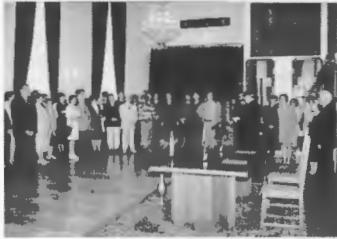
Festlicher Rahmen zur Vertragsunterschrift im Kulturpalast