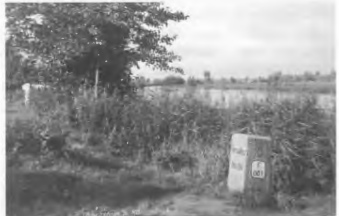
Der „Versailles-Gedenkstein“ Königsblick 1938

Weg dorthin wurde zum ehrenden Gedenken der „Königsweg“ und die Restauration erhielt den Namen „Königsblick“, so wie wir sie bis zuletzt „Daheim“ kannten.