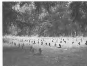
Kriegsfriedhof I. Weltkrieg in Pila-Leszkow

Ab Mitte Januar 2016 hat sich die Kreisverwaltung Pilas verpflichtet, sich um den Zustand der Bäume auf dem Kriegsfriedhof des I. Weltkrieges in Pila-Leszkow zu kümmern und diese