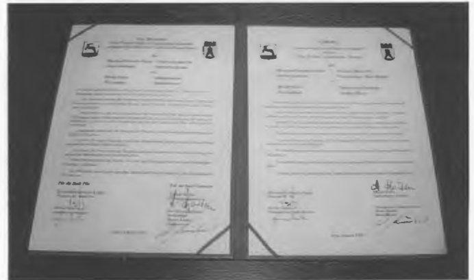
Die Vertragsurkunden nach der Unterzeichnung am 24.5.1996