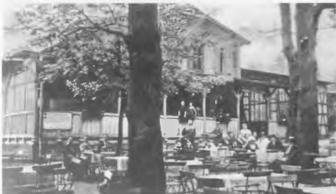
Ein Teil der Außenansicht „Waldgaststätte Königsblick“ 1930

deutschen Geschichte. Wie um nur einige zu nennen, der „Versailles Gedenkstein“, der an die ungerechte Abreissung deutscher Ostprovinzen vom 21.06.1919 erinnert. Das „Deutschtumsdenkmal“, der gigantische „Kaiser Friedrich III. Natur Findling“, der Waldtempel „Lug ins Land“ von dem aus der „Alte Fritz“ den einmaligen Blick auf Schneidemühl genossen haben soll. Die herrliche Talebene, durchzogen von der sich hier besonders schlängelnden Küddow. Im Vordergrund das Dörfchen Küddowtal und dahinter die Kirchtürme unserer Heimatstadt.