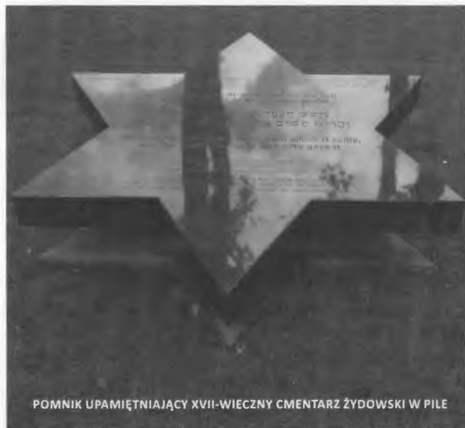
Denkmal für die schon in der Stadt oder den Konzentrationslagern umgebrachten Juden Schneidemühls durch die Nazis 1937-45

Am 2. Juni 2015 jährte sich die Enthüllung des Denkmals der ehemaligen jüdischen Be-