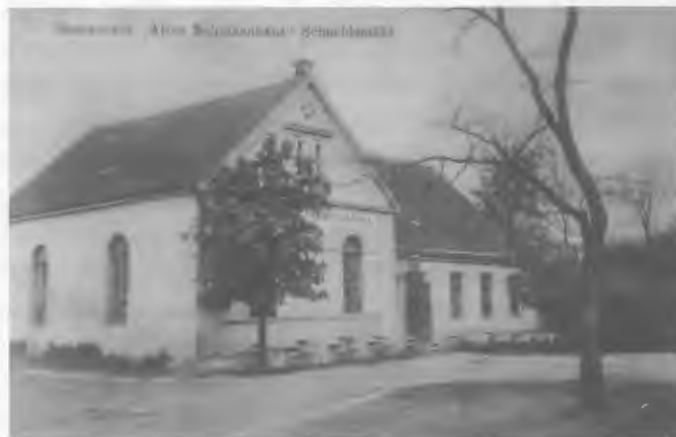
Das „Alte Schützenhaus“ 1934, damals Schützenstraße/Uscher Chaussee. Bis zuletzt eine beliebte, volkstümlich-rustikale Landgaststätte

Einige Schneidemühler stellten auch die Frage, warum ich in meiner „Gastronomie-Serie“ wohl sehr detailliert über das „Neue Schützenhaus“ in der Bergstraße geschrieben, aber nichts über das „Alte Schützenhaus“ direkt am Wege nach Usch in der Schützenstraße gesagt habe? Gibt es davon eventuell noch ein Bild? War es doch so romantisch.