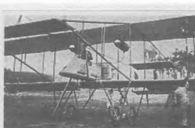
Im Sommer 1912 wurde in der Albatros-Fabrik der Typ MZ 2 mit verbleibendem Fabrikpreis

Schneidemühl eine Fabrik für Segelflieger als Forschungs- und Entwicklungsstätte für Aerodynamik als Vorstufe für Motorflugzeuge zu bauen. 1914 folgte dann die Gründung und danach der grandiose Aufbau der „Ost-deutschen Albatros-Werke“ in Schneidemühl entlang der gesamten Seminarstraße.