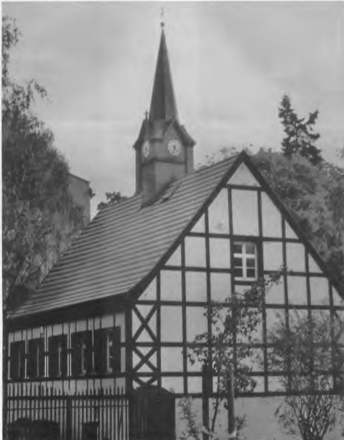
Museum Stanislaw Staszic in Schneidemühl/Pila (Seitenansicht) mit der Turmspitze der ehemaligen Lutherkirche im Hintergrund.

12. Jahrgang, 1. Ausgabe Januar/Februar 2017