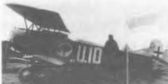
Albatros U 10

Produced in 1918 the D VII was considered the best German Fighter of the war. Its capacity for holding a steep climb without stalling made it lethal in the conventional rear attack from below. The Fokker D VII was a cleanly and simply designed aircraft. With its cantilever wings, welded steel fuselage and lack of interplane bracing wires, it anticipated future aircraft design. An improved version of the D VII With a 185 hp BMW engine allowed for greater speed and a much higher Service ceiling. This particular airplane was manufactured under contract in 1918 in the Albatros assembly factory at Schneidemühl. To its factory finish was added the large U 10 marking on the Sides of the machine, representing the 10th Uhlan Cavalry Regiment. Manufacturer: Albatros Flugzeug Werke GmbH Schneidemühl.