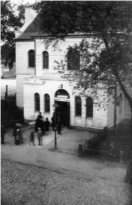
Schneidemühler Juden auf dem Weg zur Lesung der Thora beim synagogalen Gottesdienst.