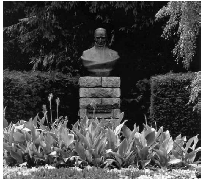
Denkmal von Stanislaw Staszic im Stadtpark von Pila