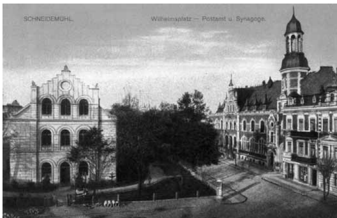
Synagoge und Postamt auf dem Schneidemühler Wilhelmsplatz.