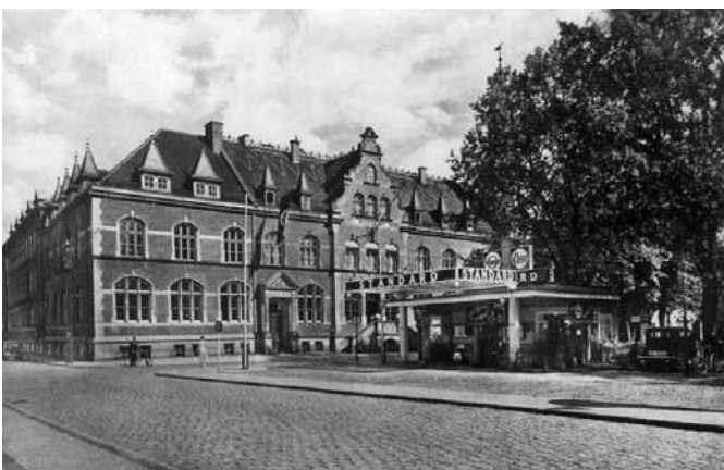
Tankstelle auf dem Wilhelmsplatz in Nachbarschaft der Synagoge. (weitere Erklärungen siehe Seite 20).