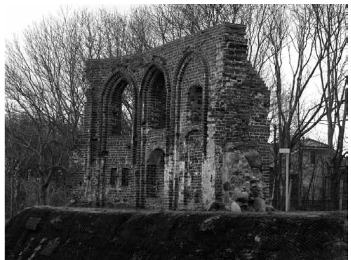
Die zur Ostsee gewandte Aussicht der gotischen Kirchenruine Hoff – polnisch Trzesacz.

Dr. Budde, der die Aushebung von Panzergräben vor Schneidemühl mit Männern des Volkssturms, Hitlerjungen und BDM-Mädchen leitete. Dafür wurden Mutter und Sohn in seinem Auto nach Berlin mitgenommen.