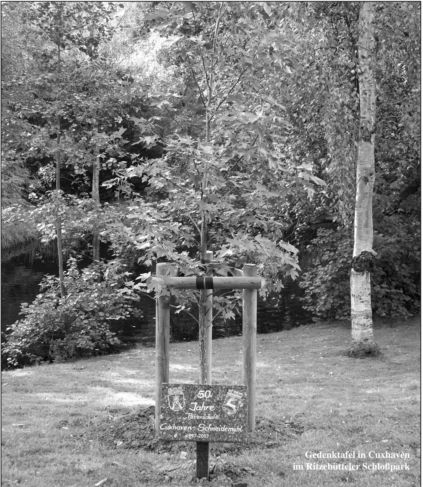
Gedenktafel in Cuxhaven im Ritzebütteler Schloßpark

7. Jahrgang; 4. Ausgabe; Juli/August 2012