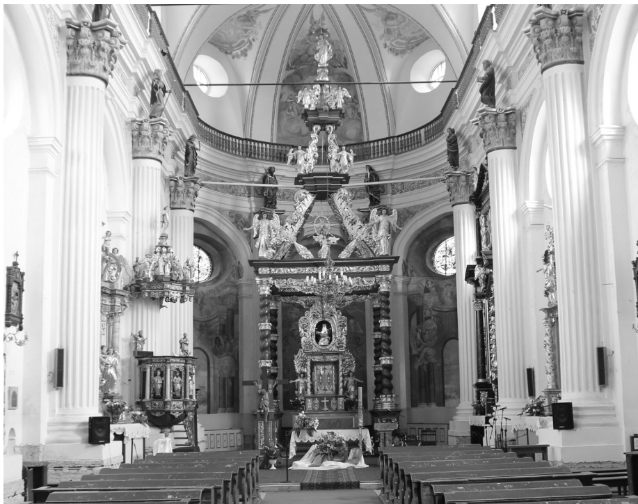
Renovierte Schrotzer Kirche von innen mit Hauptaltar

Risse sind nicht mehr erkennbar. Ausgemalt ist sind die Decke und die oberen zwei Drittel der Seitenwände. In würdigem Glanz erscheinen der Hochaltar und alle vier Seitenaltäre. Im Hochaltar steht die Kopie der Pieta, die sonst in der Trage-Vorrichtung seitlich vom Volksaltar stand. Das Original der Pieta ist zur Renovierung in Warschau.