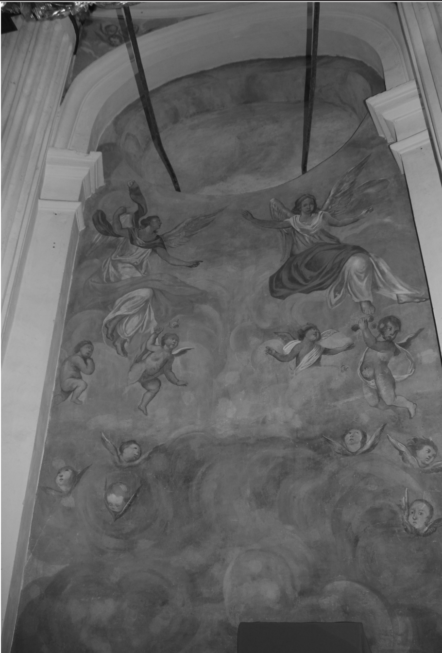
Mittleres Feld der Schrotzer Kirche in der Chorwand direkt hinter dem Hauptaltar