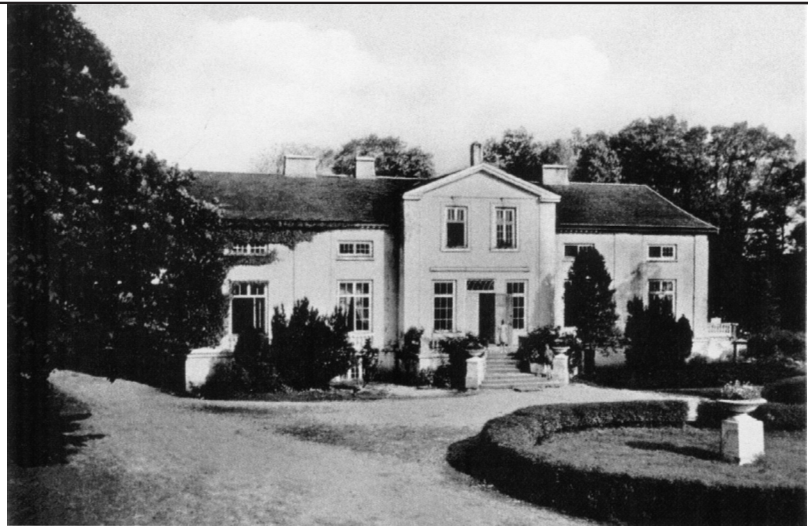
Das Gutshaus von Pickwa

Diese Balten sollten wir später wiedersehen, mein Vater und ich trafen sie, von der „Treckleitstelle“ – soweit reichte