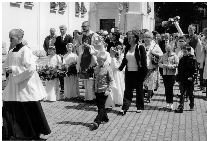
Der geweihte Priester bei der Prozession um die Familienkirche