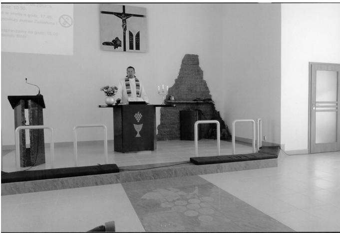
Der polnische Kaplan, Tomasz Wola, beim ökumenischen Gottesdienst in der Evangelischen Kirche Pilas