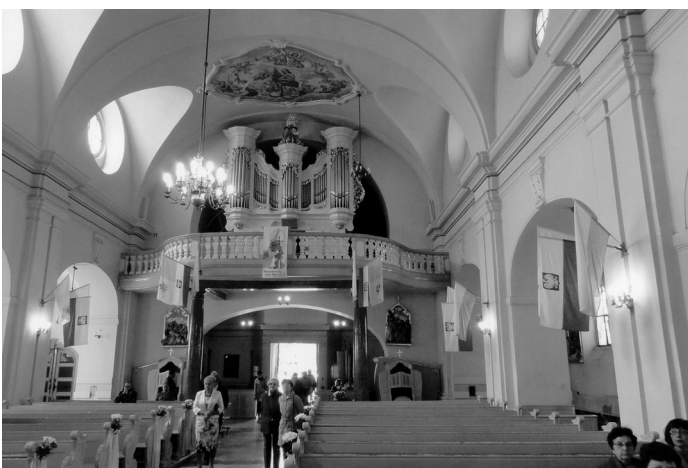
Die wiederhergestellte Orgel der Familienkirche