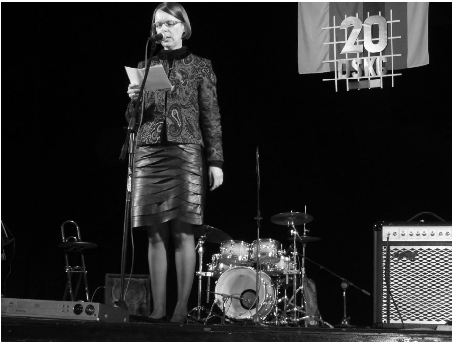
Die Generalkonsulin der Bundesrepublik Deutschland, Annette Klein, aus Danzig, bei Ihrer polnisch gehaltenen Festansprache zum 20 jährigen Bestehen der DSKG in Schneidemühl/Pila am 02. Juni 2012

Bund nord-schleswiger , die den weitesten Weg zu Ehren der Deutschen Minderheit zurück gelegt hatten.