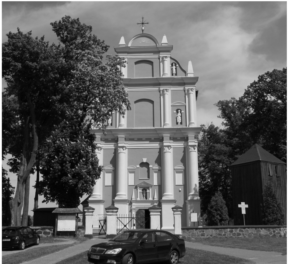
Renovierte Schrotzer Kirche von außen

Um es gleich vorweg zu sagen. Die Schrotzer Kirche St. Maria Himmelfahrt wird sehr schön. Nach vielen Verzögerungen wird das Haus Gottes gründlich renoviert. Fertig gestellt ist die Sanierung der Fundamente. Außerdem erhielt der Bau ein neues Dach. Die auseinanderstrebenden Seitenwände wurden schon vor längerer Zeit durch Zuganker fixiert. Der Außenanstrich ist weitgehend abgeschlossen. In den Tagen unserer Anwesenheit wurde das Gerüst an der rechten Seitenwand auf-