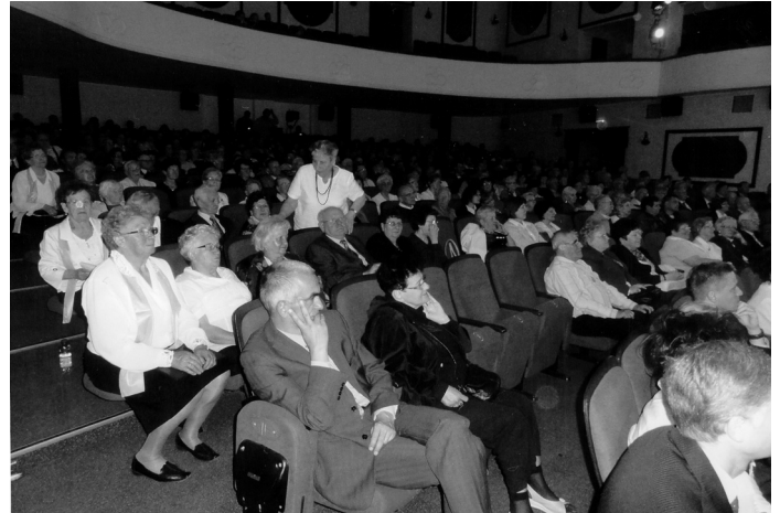
Gefüllter „Dom Kulturey“ in Pila zum Festakt am 2.6.2012