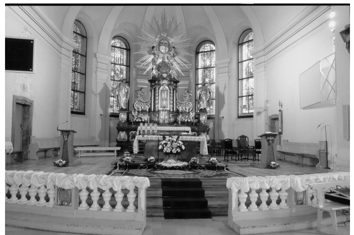
Hochaltar der Schneidemühler Familienkirche. Im II. Weltkrieg nicht zerstört!