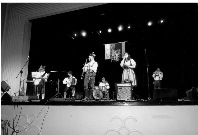
Musikgruppe „Tyrolia Band“ aus Schlesien