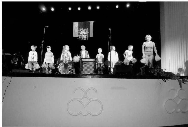
Aufführung der Kindergartengruppe