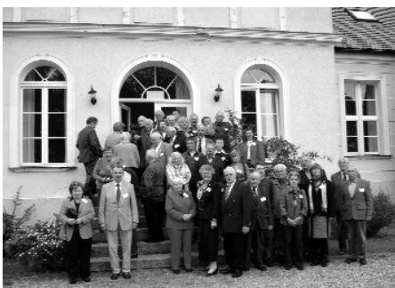
Die Teilnehmer der PKST – Tagung am 15. Oktober 2010 vor der Europäischen Akademie Külz – Kulice