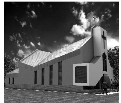
Model der Evangelischen Kirche

Vogt, Ursula geb. Glasneck, geb. am 27.11.44, 74182 Obersulm, R.-Wagner- Str. 1 (Friedrichstr. 30)