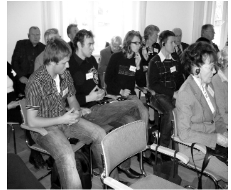
Studierende der Universität Stettin / Szczecin als aufmerksame Zuhörer

Wer nun auf eine lebhafte Diskussion gehofft hatte, wurde enttäuscht. Insbesondere blieben die polnischen Studenten während der gesamten Tagung „stumm“, vielleicht war auch die „Hemmschwelle“ vor ihren Pro-