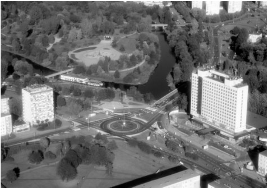
Marktplatz mit Hotel Gromada, im Hintergrund die Küddow

Bielefeld, Detmolderstr. 263 (Schönlankerstr. 111), Karl-Ernst Weinberger (7.9.29) 91058 Erlangen, Marienbaderstr. 8 (Friedrichstr. 31), Erika Wendler (17.9.19) 45478 Mühlheim-R., Friedhofstr. 126 (Friedrichstr. 17)