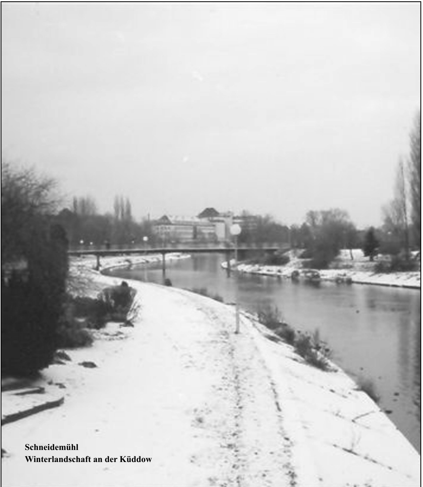
Schneidemühl Winterlandschaft an der Küddow

2. Jahrgang; 6. Ausgabe; November/Dezember 2007