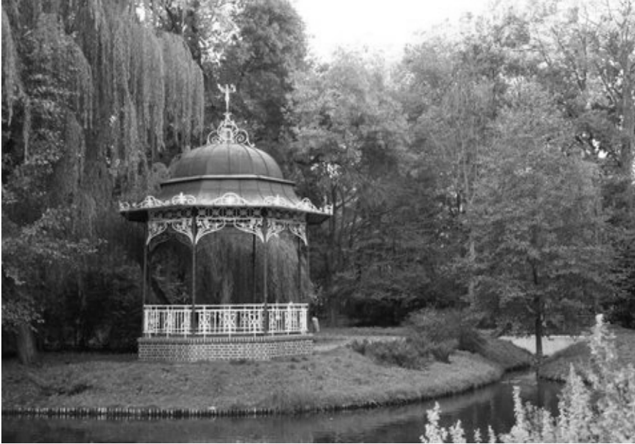
Pavillon im Stadtpark

flotten Tänzer legten sie eine flotte Sohle auf's Parkett, das man seine helle Freude dran hatte, aber auch kein Wunder, bei der flotten Musik von unserem Kapellmeister Hans Pfetzer, tanzten die Füße schon allein.