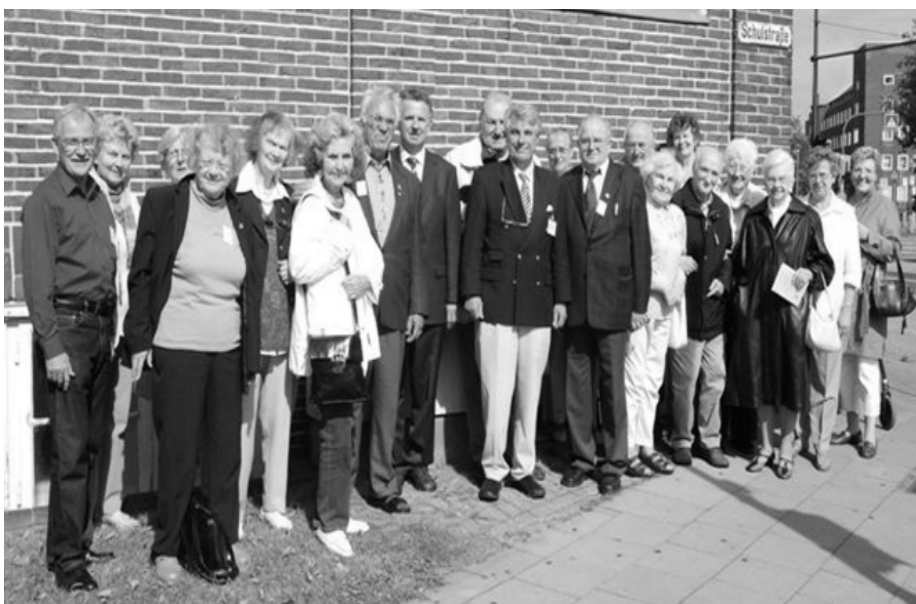
Delegierte und Gäste vor den Heimatstuben