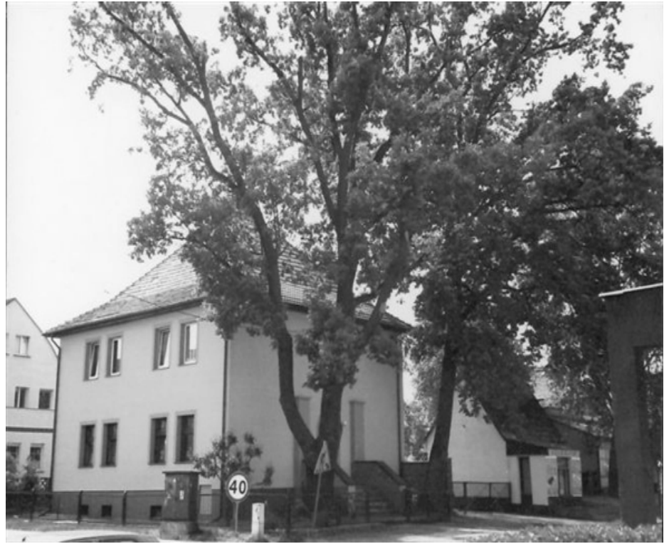
Heute - Hermann-Löns-Str. 1