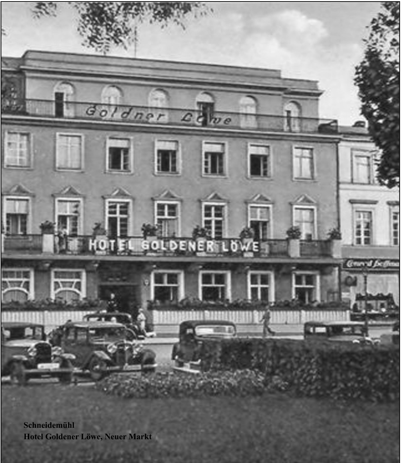
Schneidemühl Hotel Goldener Löwe, Neuer Markt

2. Jahrgang; 5. Ausgabe; September/Oktober 2007