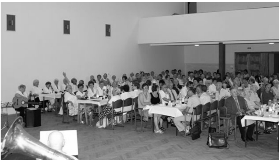
Der vollbesetzte Saal des Freiherr von Stein Gymnasiums