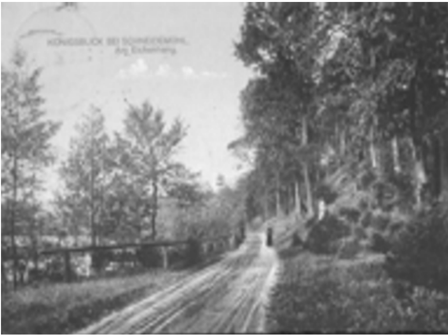
Königsblick bei Schneidemühl. Am Eichenhang.