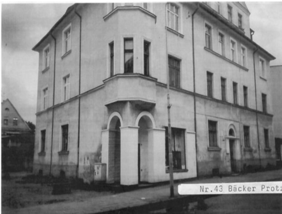
Gartenstraße 43, Bäckerei Protz