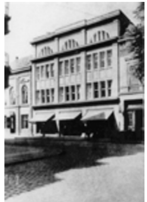
Kaufhaus "Epa" in der Posenerstraße