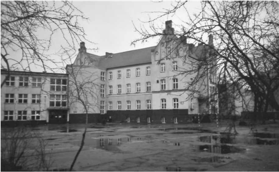
Rückansicht der Ober-Realschule in der Saarlandstraße