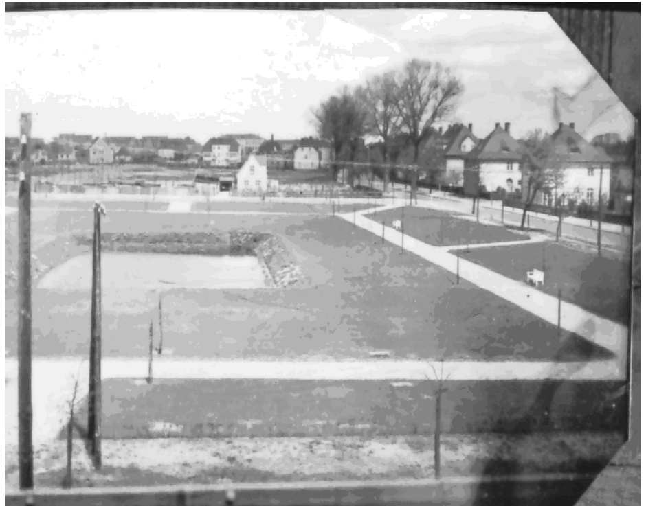
ca. 1939 Aufnahme vom Dach des Hauses Skarrakplatz 3/4 rechts Schmiedest. links Schönlancker Str.