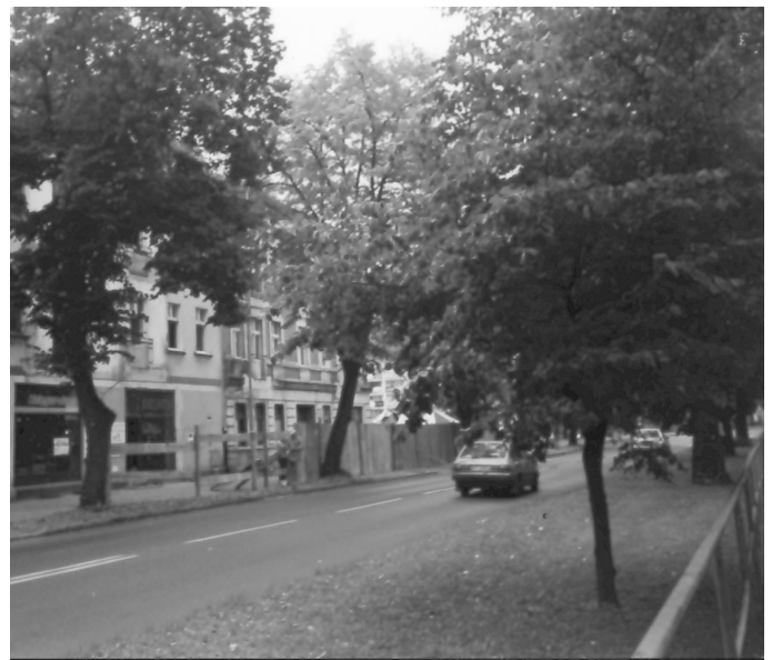
Die Brombergerstrasse im Jahr 2000. Die Häuser wurden abgerissen. Wer hat darin gewohnt ?