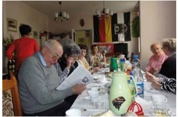
Heimatbrief auch beim Kaffeetrinken interessant