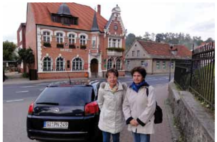
Das Rathaus von Usch/Netzekreis