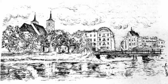
Schneidemühl, an den Ufern der Küddow.

über dem Ufer der Küddow: Der kath. St. Johanneskirche. Sie lag im Schnittpunkt von 4 großen Sichtachsen unserer Heimatstadt: Von Westen herkommend von der Mühlenstraße, von Norden von der Jastrower Allee von Süden vom Wilhelmsplatz, von Osten von der Bromberger Straße.