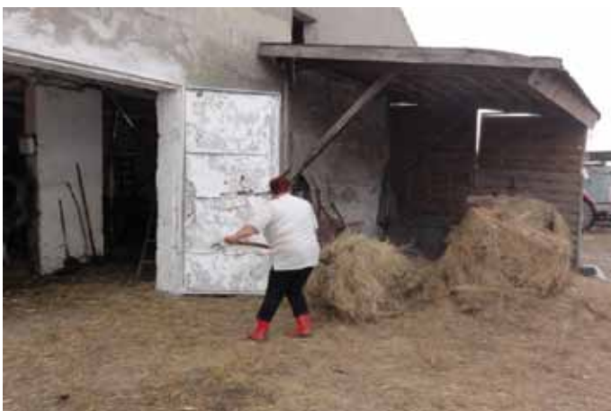
Schwerstarbeit auf dem Bauernhof