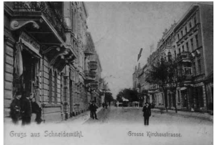
Standpunkt Wilhelmsplatz vor dem HPA mit Blick nach Norden durch die prächtige Kirchstr. zu den 2 Türmen der Johanneskirche. 1930 noch Große Kirchenstraße.

Im Zuge der in diesem Jahr vielen Straßenumbenennungen erhielt sie dann ihren Namen Kirchstraße und die Kleine Kirchenstr. - Schlageter Straße, so wie wir diese beiden Straßen bis zur Flucht Ende Januar 1945 kannten. Durch meine „Schneidemühler Heimatbilder“ habe ich die meisten pulsierenden Geschäftsstraßen des Zentrums vor unserem geistigen Auge wieder erstehen lassen, aber bisher noch niemals über die Kirchstr. geschrieben, was ich nun heute hiermit tue. Dazu 2 Fotoreproduktionen von hist. Ansichtskarten, die zuvor noch niemals veröffentlicht werden konnten und die ich in einem Antiquariat in Bromberg entdeckt und gleich für mein Heimat-Archiv erworben habe.