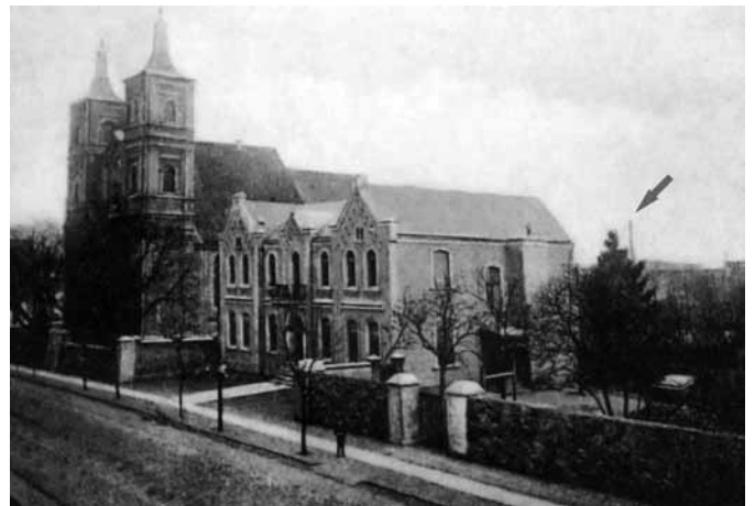
Johanneskirche und kath. Prälatur 1930 (Im Hintergrund Grenzmark-Brauerei mit ihrem hohen Turm sichtbar) heute alles verschwunden.