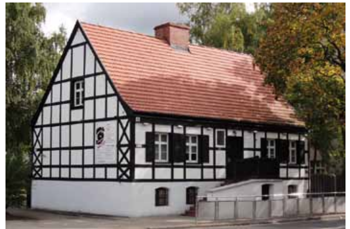
Museum Stanislaw Staszic