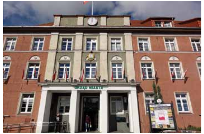
Rathaus in Pila