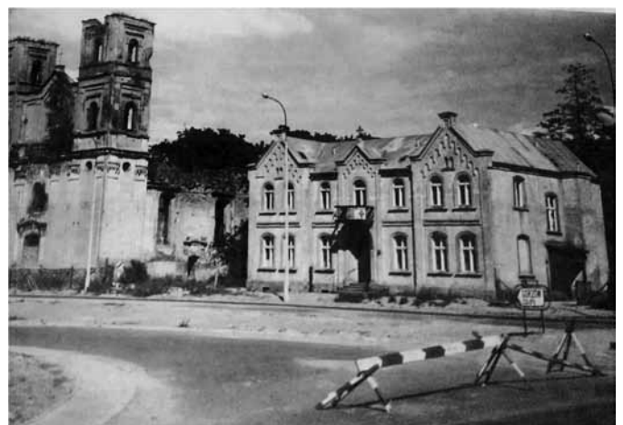
Johanneskirche und Prälatur 1947