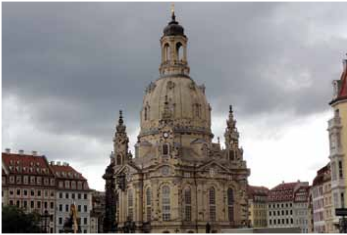
Dresdner Frauenkirche - Symbol für Frieden/Wiederaufbau