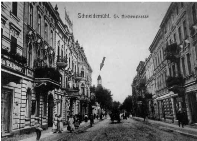
Standpunkt Johanneskirche mit Blick von Norden durch die Kirchstraße. Im Hintergrund der hohe Turm des Haupt-Postamtes Schneidemühl um 1920!