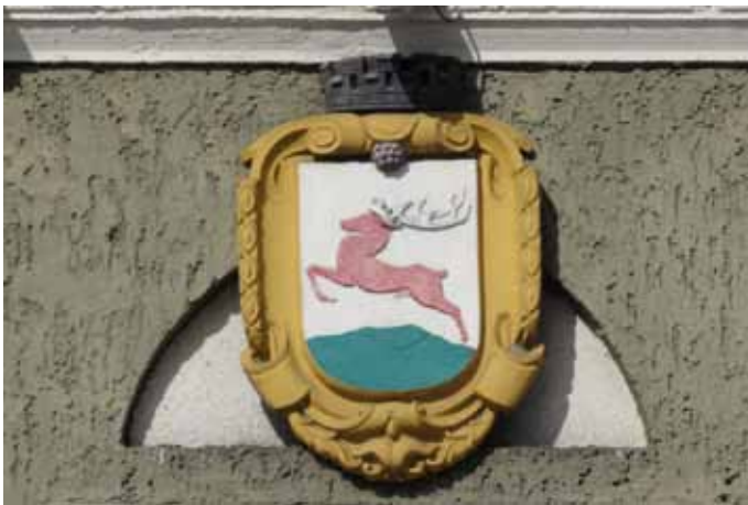
Hirsch mit Krone am Rathaus von Pila