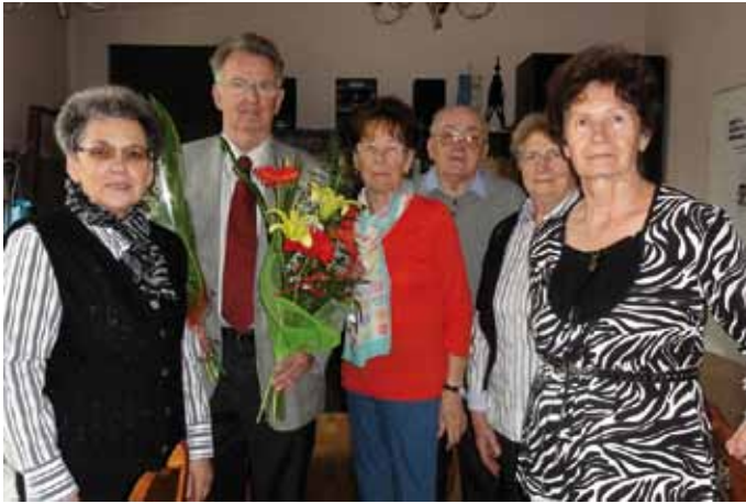
Geburtstagsempfang für den HK-Vorsitzenden am 24.09.2013 im Büro der DSKG