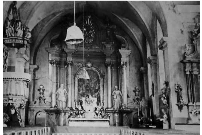
Blick in den Innenraum der Johanneskirche - unseren „Schneidemühler Petersdom Rom“ wie wir ihn stolz nannten!